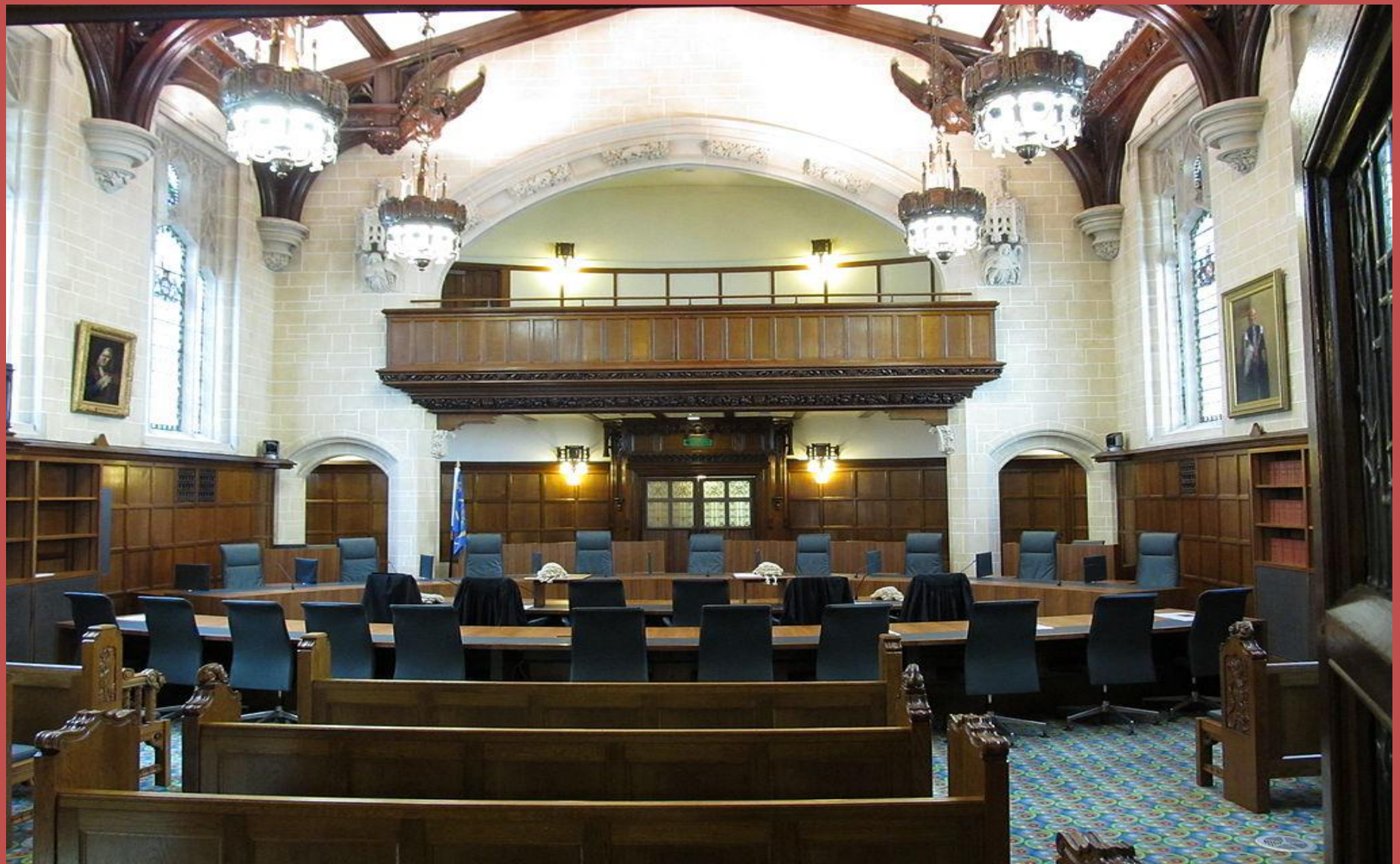
Зал заседаний Верховного суда Великобритании