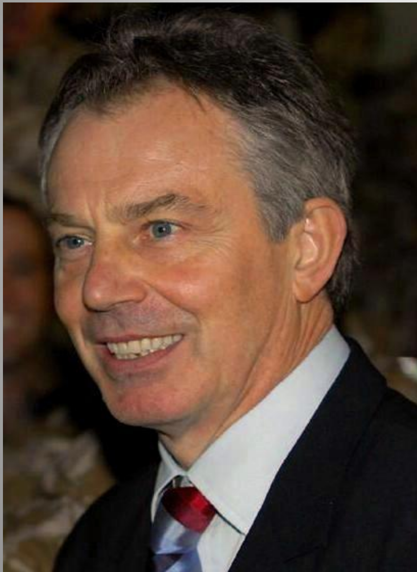
Энтони Блэр (1997—2007 гг.)