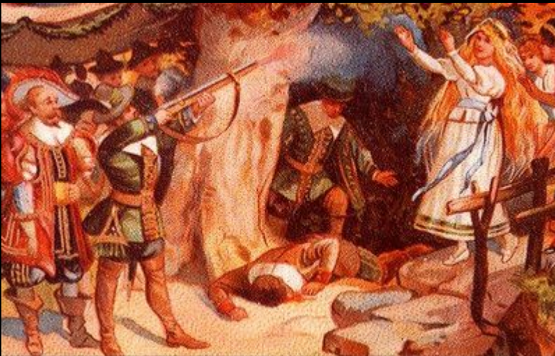
Опера «Вольный стрелок» К. Вебер

В Германии романтизм впервые проявился в творчестве К. Вебера («Вольный стрелок») и Ф. Шуберта (вокально-симфоническое и фортепианное творчество). Позже значительных достижений в симфоническом, фортепианном и вокальном жанрах достигли Ф. Мендельсон и Р. Шуман. Крупнейшими оперно-симфоническими композиторами XIX века стали Р. Вагнер и И. Брамс. Композиторы-антиподы, они олицетворяли два течения зрелого романтизма - тяготение к программной музыке, к отказу от классических форм построения музыкального произведения (Вагнер) и романтизм, внешне облеченный в более строгие, академические формы (Брамс), больше связанный с классическим наследием прошлого.