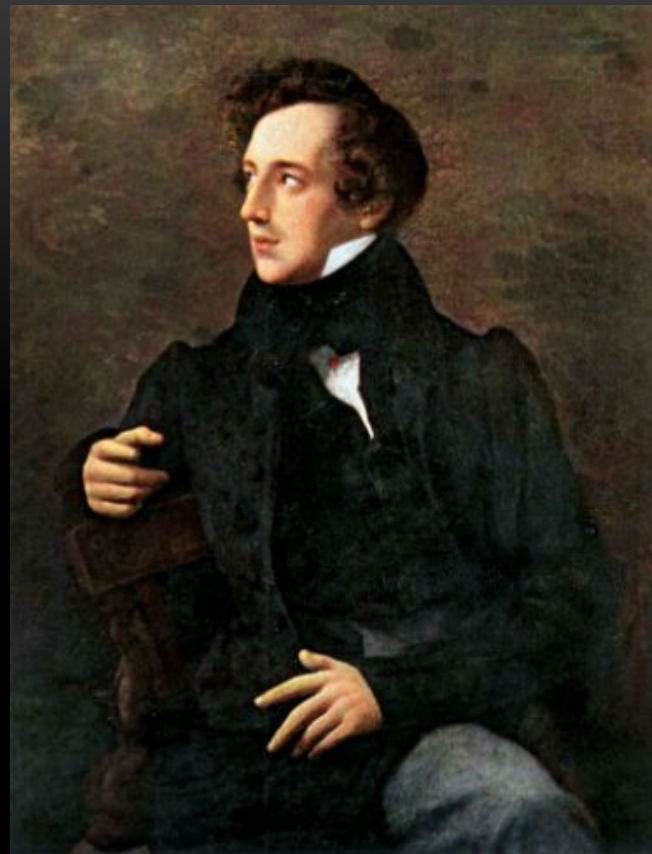
Мендельсон (Мендельсон-Бартольди) Феликс (1809-1847)

Немецкий композитор, дирижер, пианист и органист. Основатель первой немецкой консерватории (1843, Лейпциг). Симфонии («Итальянская», 1833; «Шотландская», 1842), симфоническая увертюра «Фингалова пещера» (1832), музыка к пьесе У. Шекспира «Сон в летнюю ночь» (1825), концерты для скрипки, для фортепиано с оркестром, «Песни без слов» (1845) для фортепиано, оратории.