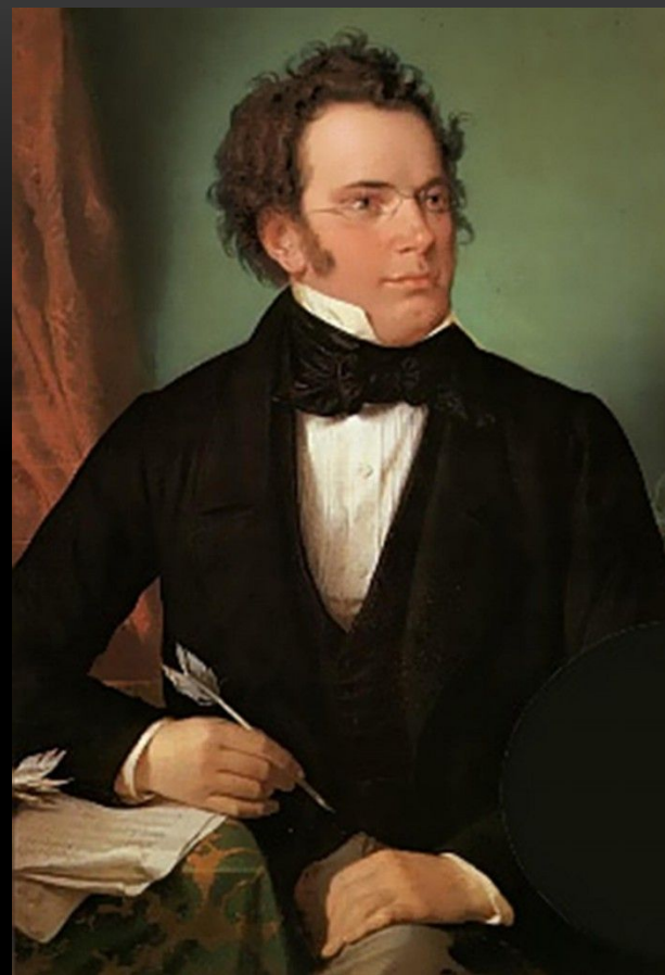
Шуберт Франц (1797-1828)

Австрийский композитор. Создатель романтических песни и баллады, вокального цикла, фортепианной миниатюры, симфонии, инструментального ансамбля. Песенность пронизывает сочинения всех жанров. Автор около 600 песен (на слова Ф. Шиллера, И. В. Гете, Г. Гейне), в т. ч. из циклов «Прекрасная мельничиха» (1823), «Зимний путь» (1827, оба на слова В. Мюллера); 9 симфоний (в т. ч. «Неоконченная», 1822), квартеты, трио, фортепианный квинтет «Фореллен» («Форель», 1819); фортепианные сонаты, экспромты, фантазии, вальсы, лендлеры.