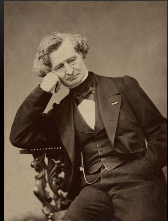
Берлиоз Гектор (11 декабря 1803, Ля-Кот-Сент-Андре, — 8 марта 1869, Париж)

Французский композитор, дирижер. Член Института Франции (1856). Создатель романтической программной симфонии. Новатор в области музыкальной формы, гармонии, инструментовки. Стремился к театрализации симфонического жанра, к монументальности вокально-инструментального стиля, к гротесковому заострению образов. «Фантастическая симфония» (1830), «Траурно-триумфальная симфония» (1840), опера-дилогия «Троянцы» (1859), Реквием (1837) и др. Наряду с Р. Вагнером создатель новой школы дирижирования. Трактат «Дирижер оркестра» (1856). «Мемуары» (т. 1-2, 1860).