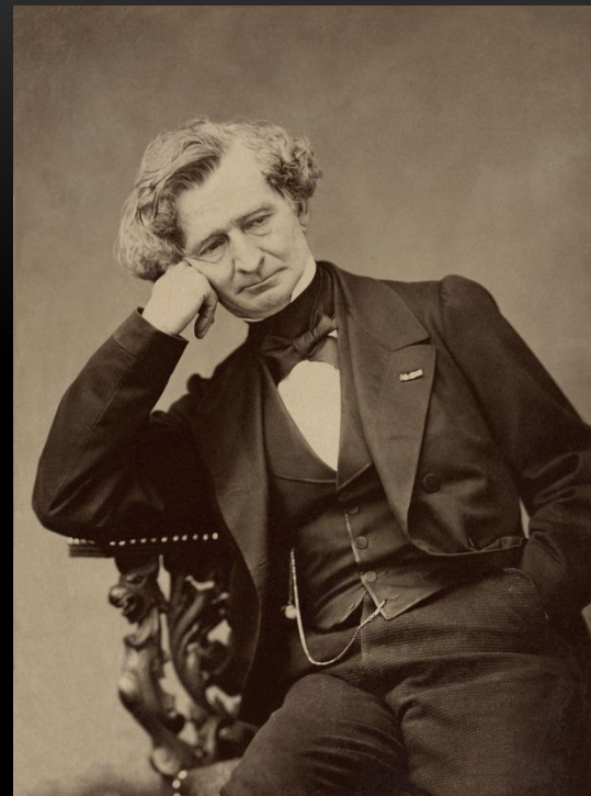
Берлиоз Гектор (11 декабря 1803, Ля-Кот-Сент-Андре, — 8 марта 1869, Париж)

Французский композитор, дирижер. Член Института Франции (1856). Создатель романтической программной симфонии. Новатор в области музыкальной формы, гармонии, инструментовки. Стремился к театрализации симфонического жанра, к монументальности вокально-инструментального стиля, к гротесковому заострению образов. «Фантастическая симфония» (1830), «Траурно-триумфальная симфония» (1840), опера-дилогия «Троянцы» (1859), Реквием (1837) и др. Наряду с Р. Вагнером создатель новой школы дирижирования. Трактат «Дирижер оркестра» (1856). «Мемуары» (т. 1-2, 1860).