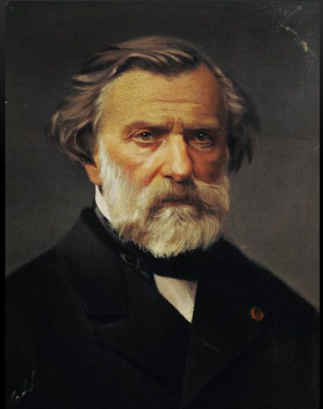
Томас Амбруз (1811-1896)

Французский композитор. Один из создателей жанра лирической оперы: «Миньон» (1866), «Гамлет» (1868). Автор комических опер «Кади» (1849), «Сон в летнюю ночь» (1850), балетов и др. С 1856 профессор (в 1871-96 директор) Парижской консерватории.