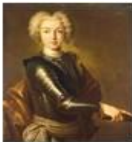
Пётр II 6 мая 1727 – 19 января 1730