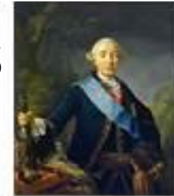
Пётр III Фёдорович 25 декабря 1761 – 28 июня 1762