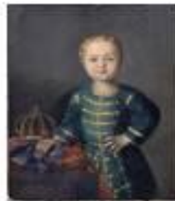
Иоанн VI Антонович 17 октября 1740 – 25 ноября 1741