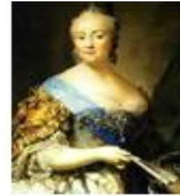
Елизавета Петровна 25 ноября 1741 – 25 декабря 1761

П.И. Шувалов, М.И. Воронцов, А.Г. Разумовский