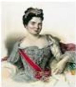
Екатерина I 28 января 1725 – 6 мая 1727