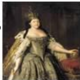
Анна Иоанновна 15 февраля 1730 – 17 октября 1740