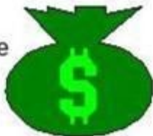
Кредитно- денежная система