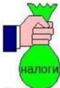
Финансово- кредитное регулирование