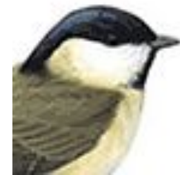
Черноголов ая гаичка