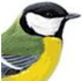
Больша я синица