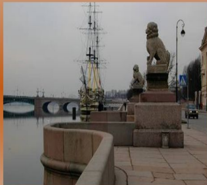
Каменные мосты Петербурга.