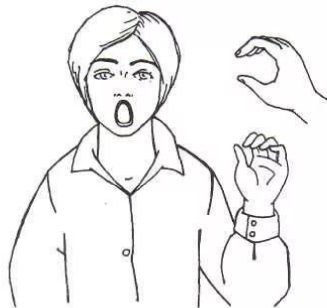
Рис. 3. Ручная поза звука [o] «Хоботок»

На звук О мы широко открываем рот, губы как бы округляются. Совместно с движением рта закругляем пальцы рук. Ладони направлены от себя.