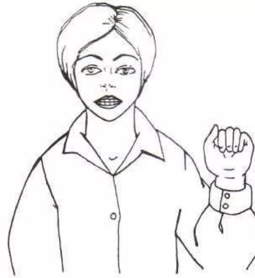
Рис. 4. Ручная поза звука [и] «Заборчик»

На звук И мы открываем рот и растягиваем губы в улыбке. Совместно с движением рта сжимаем ладонку в кулачок. Ладони направлены от себя.