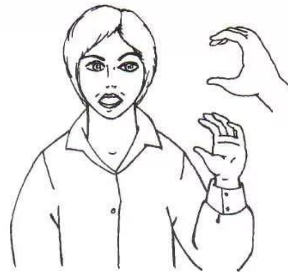
Рис. 6. Ручная поза звука [э]

Звук Э мы учимся произносить так: открываем рот чуть шире, чем на звук И, растягиваем губы в улыбке. Напрягаем горлышко, т.к. довольно часто у детей звук Э в словах и фразе звучит как звук Е. Произносим в таких случаях звук утрированно. Совместно с движением рта закругляем пальцы рук. Ладони направлены друг к другу.