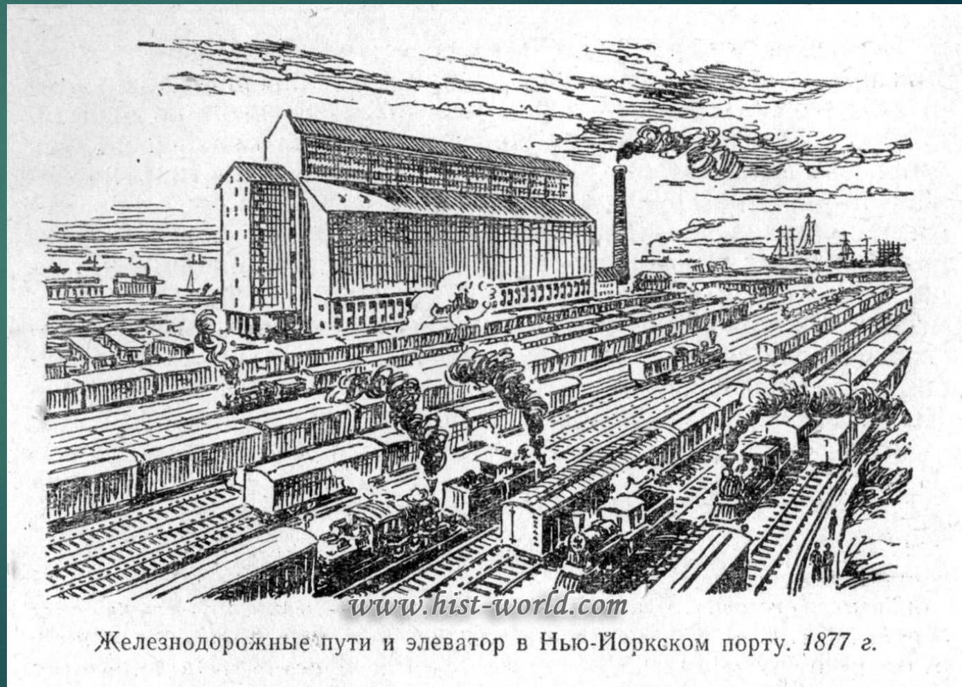
Железнодорожные пути и элеватор в Нью-Йоркском порту. 1877 г.