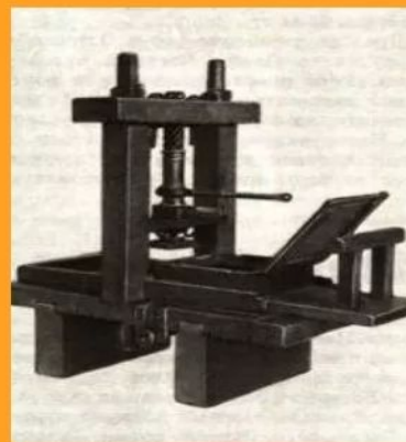
Первый печатный станок