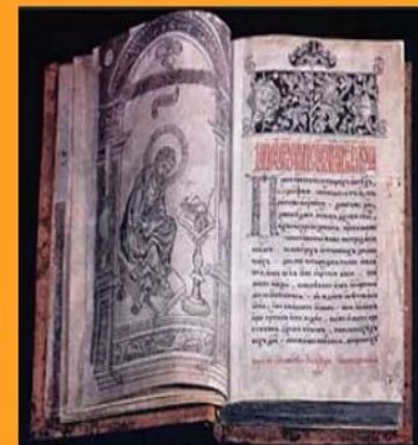
Первая печатная книга «Апостол»

В сер. 16 в. в Рос сии возникло книгопечатание. Возросло число образованных людей как среди духовенства, так и среди светских лиц (аристократов, деятелей гос. управления, ди пломатической службы, воен ных).