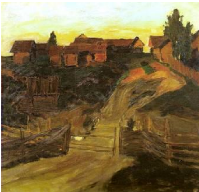
«Последние лучи солнца», 1899 год Государственная Третьяковская галерея