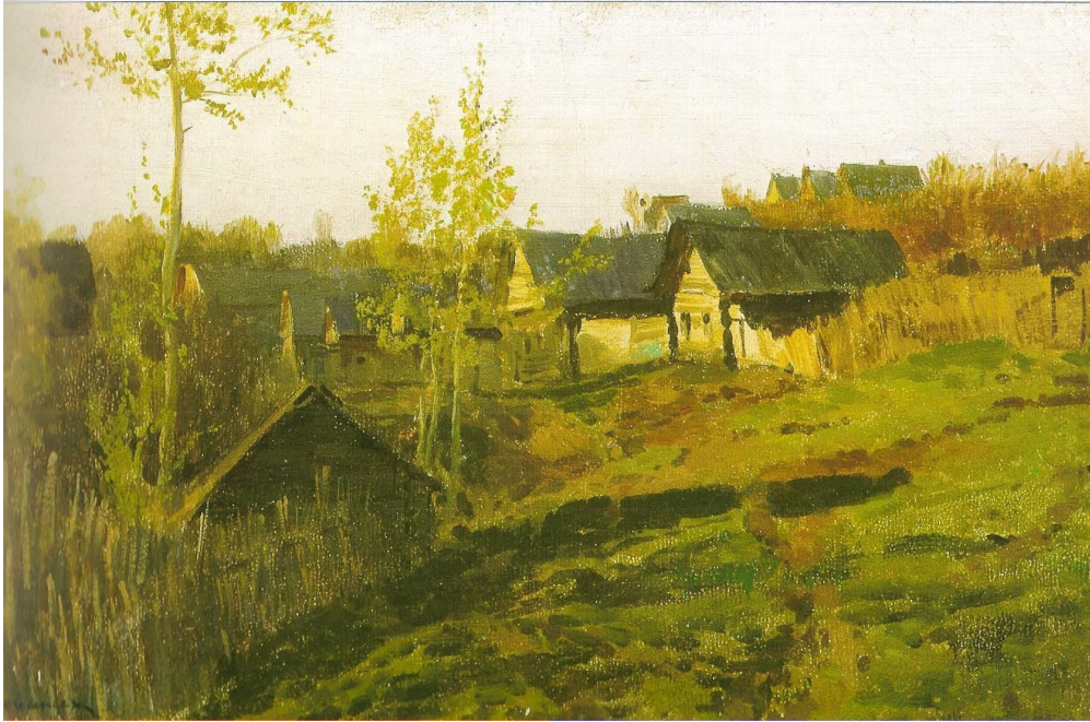
«Деревня. Серый день».