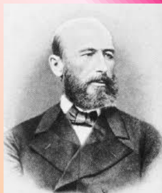
Бутлеров Александр Михайлович