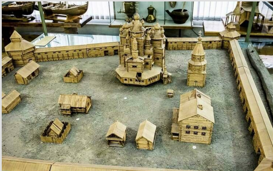
Макет Кольского острога (крепости) работы К. Наполова