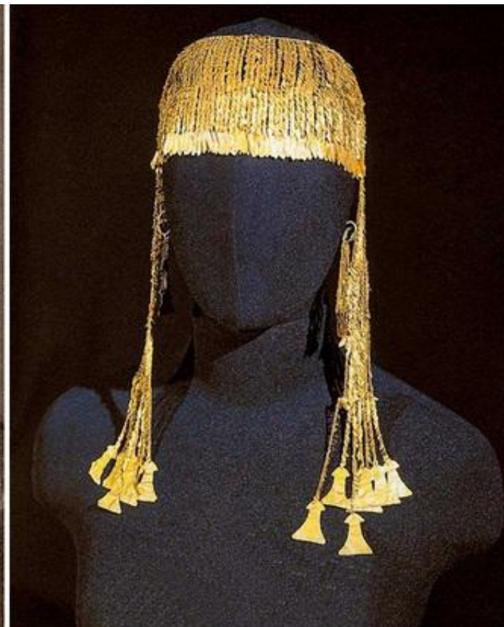
Жена Шлимана в украшениях Елены