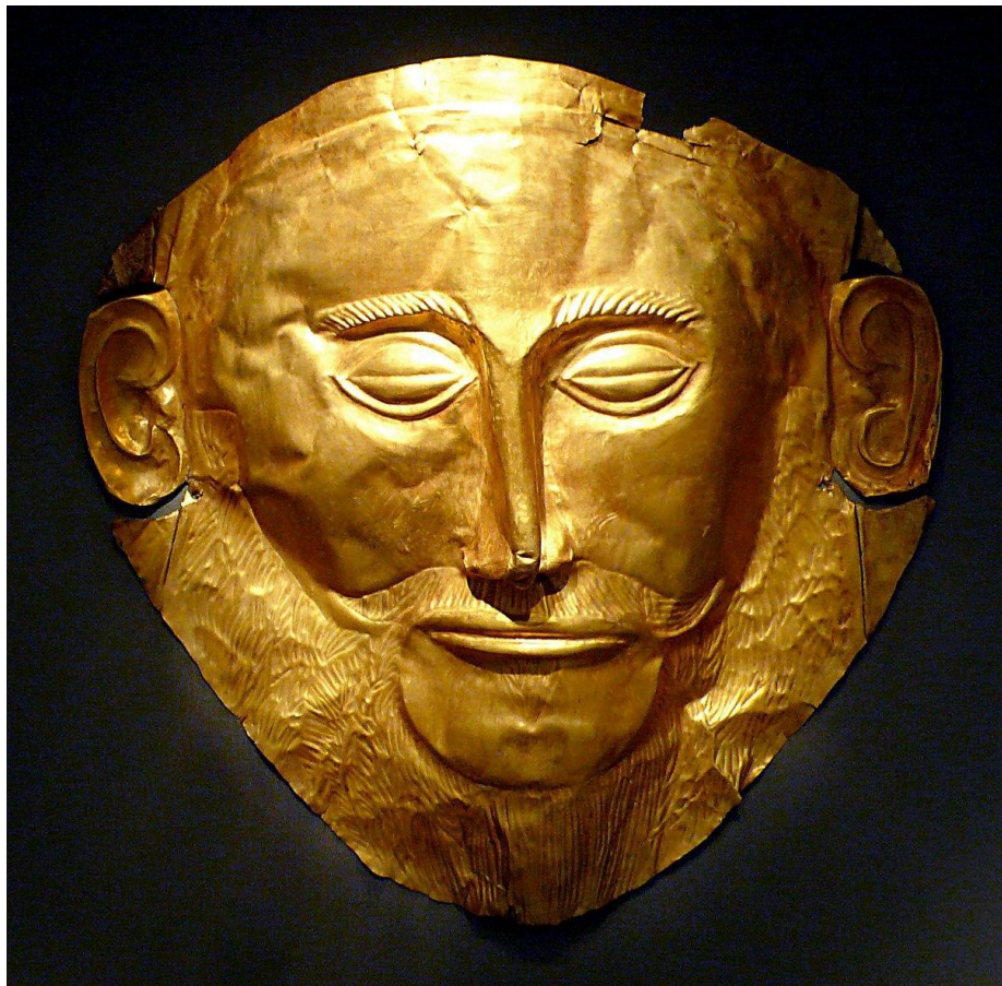
Маска Агамемнона, XVIв. До н. э.