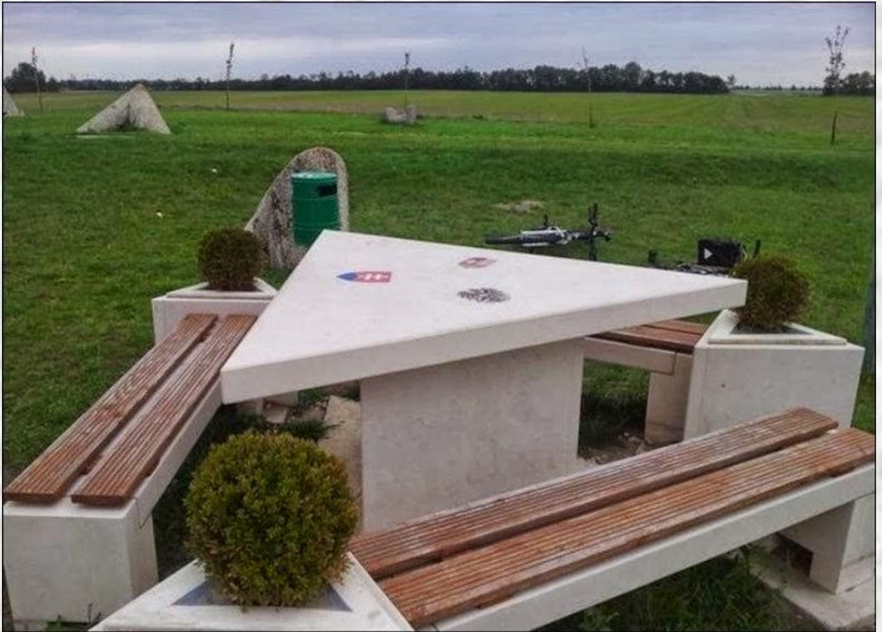
Österreich – Slowakien – Ungarn (3 Grenzen Punkt)