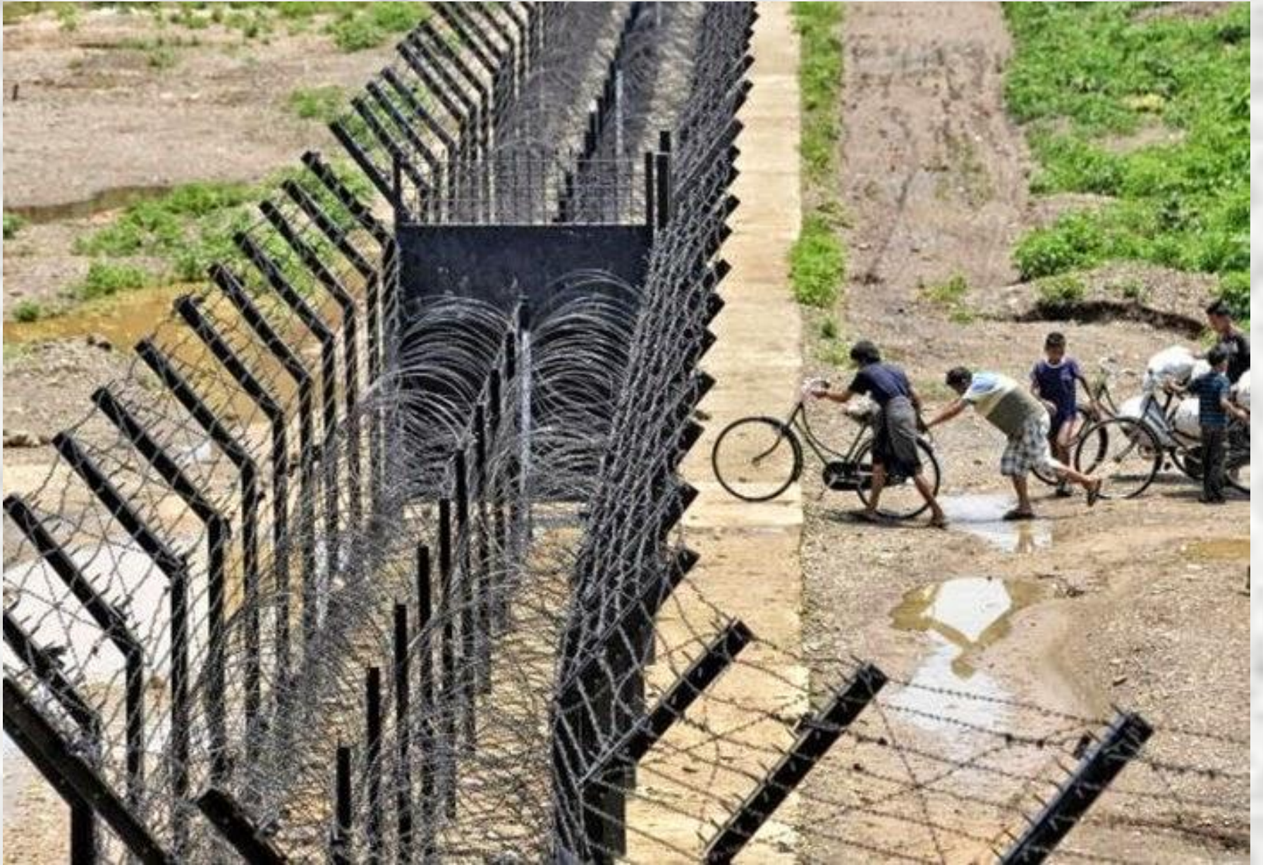
INDIAEN - MYANMAR