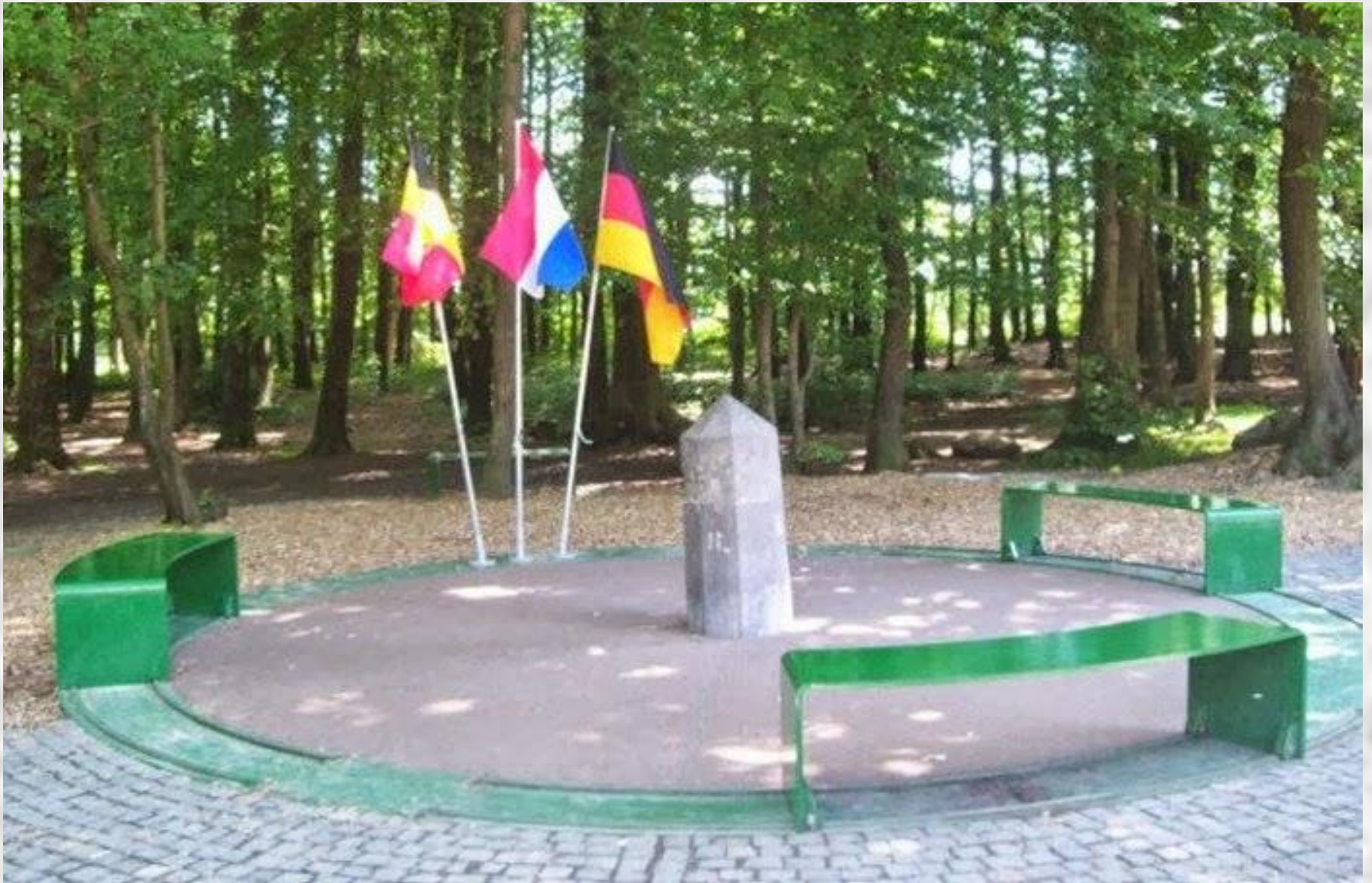
Holland –Deutschland – Belgien (3 Grenzen Punkt)