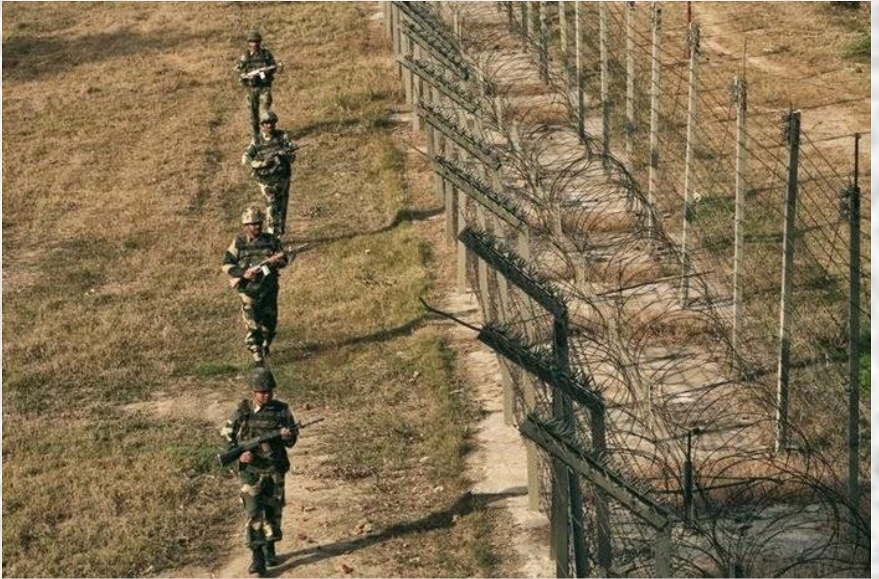
INDIEN - PAKISTAN