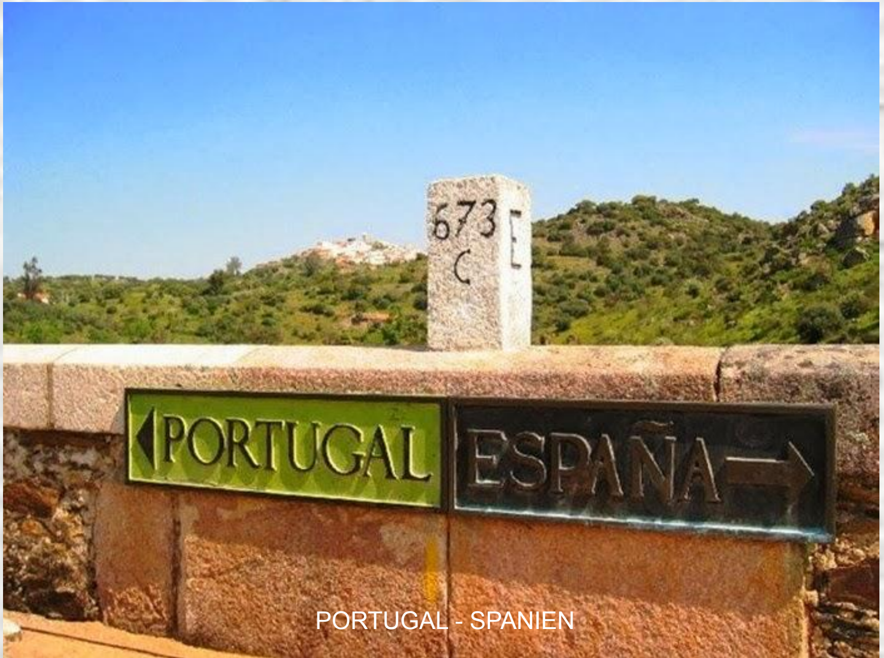
PORTUGAL - SPANIEN