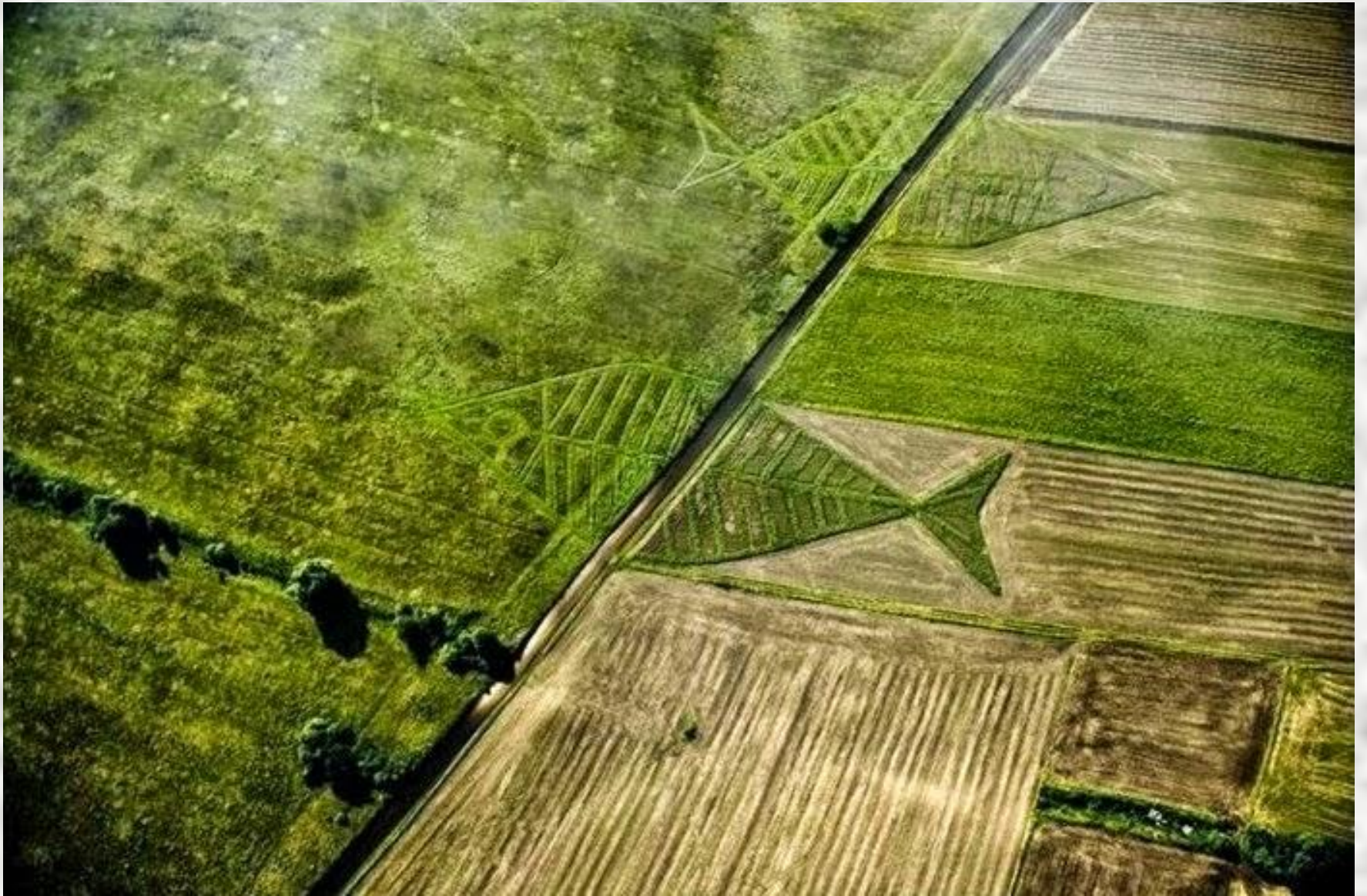
Ukraine - Polen