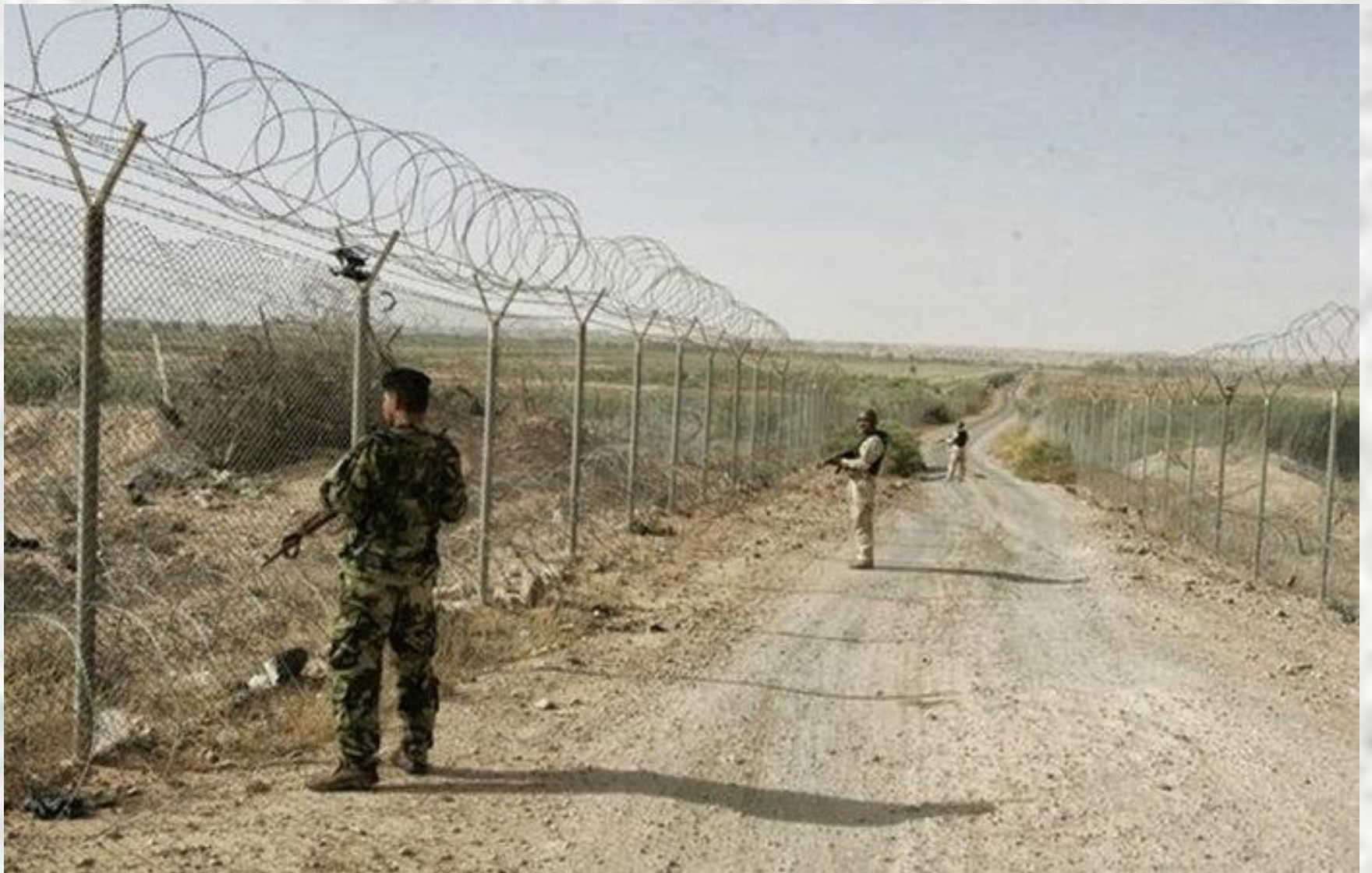
SYRIEN - IRAK