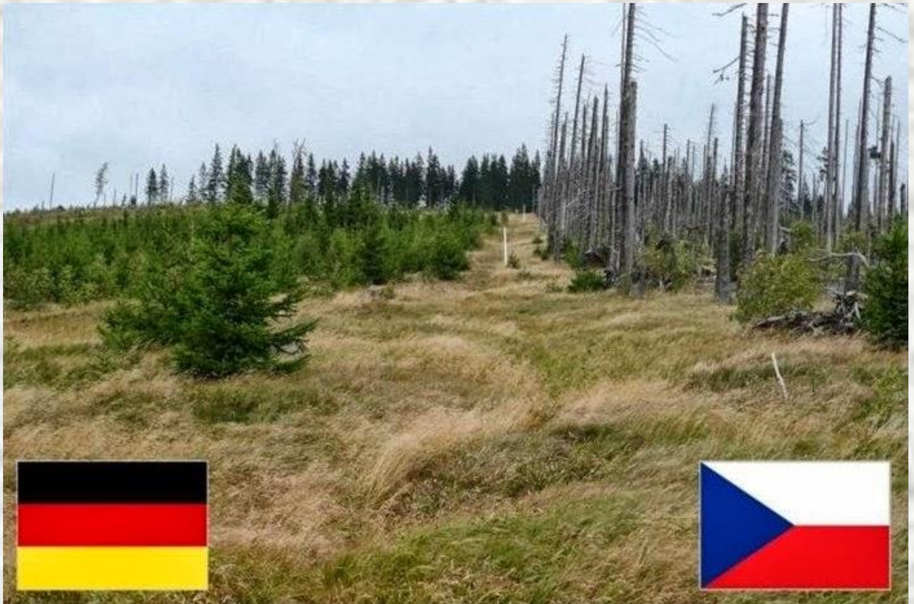
Deutschland - Tschechien