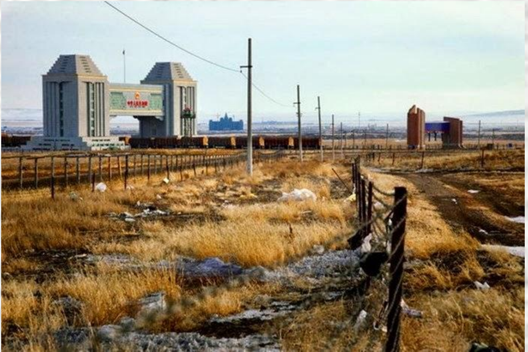
CHINA - Russland