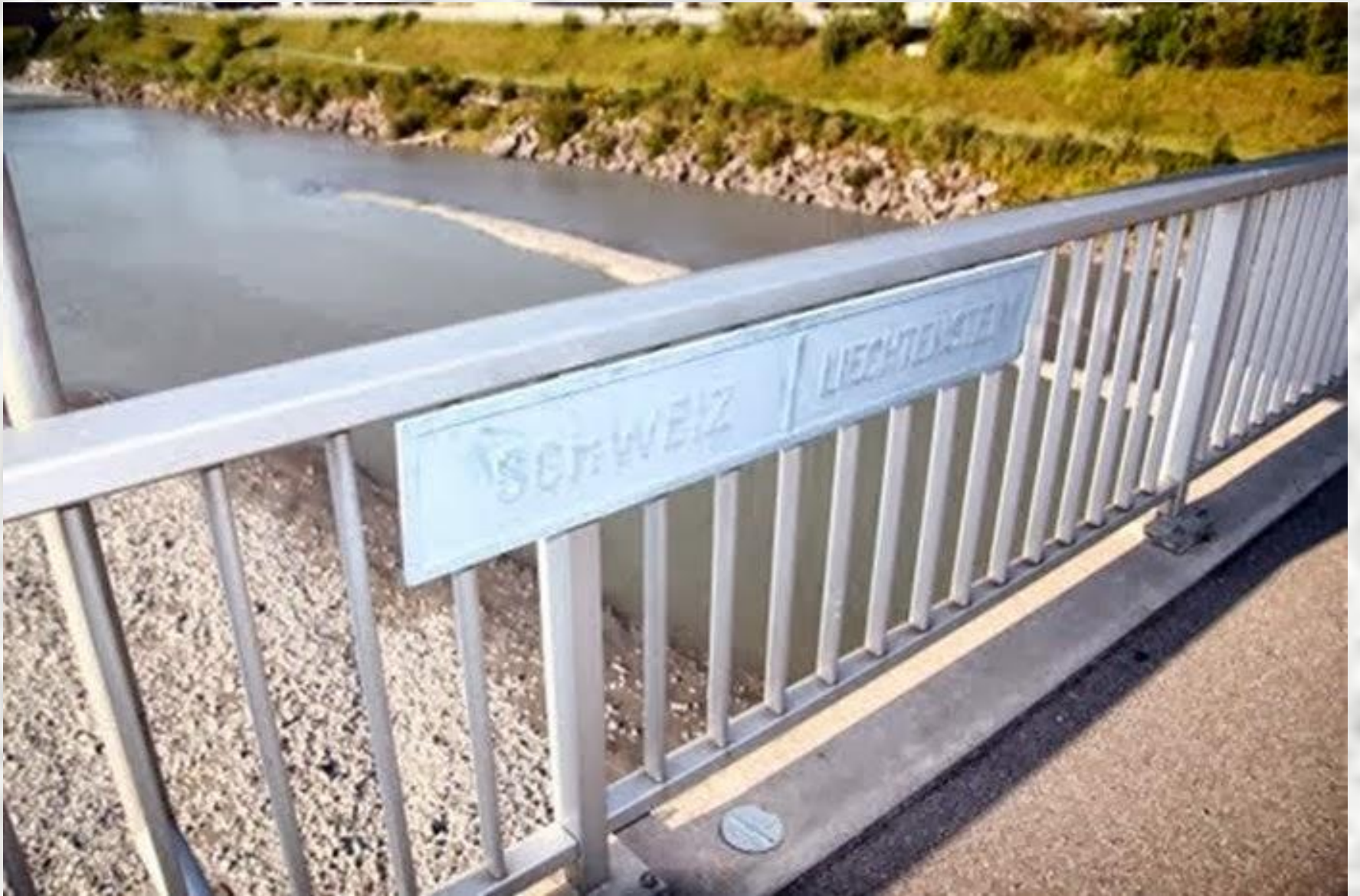
Schweiz - LICHTENSTEIN