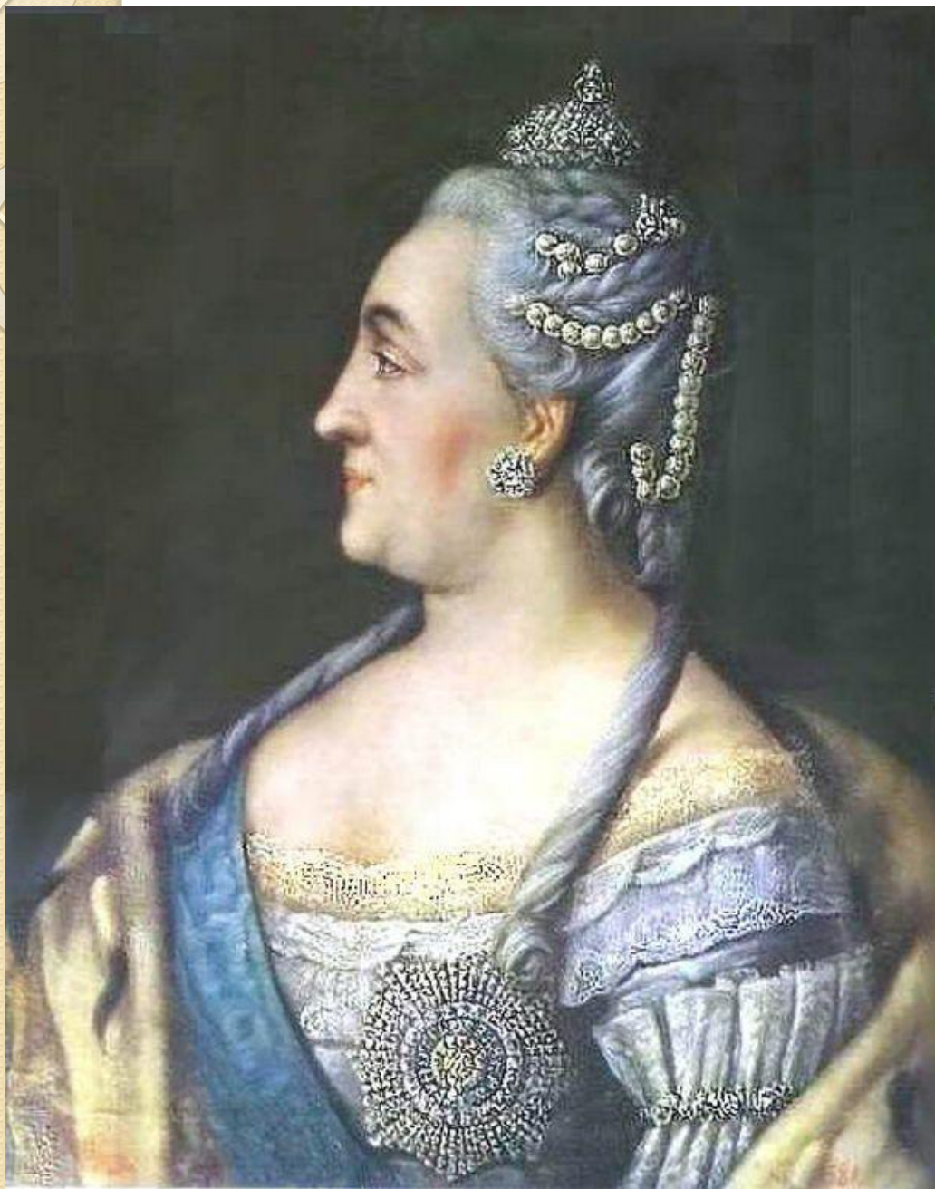
Алексей Петрович Антропов, портрет Екатерины II в профиль.