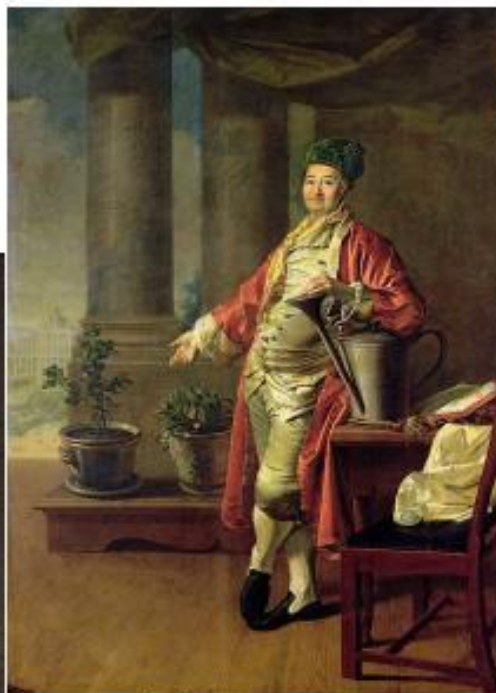
Портрет П. А. Демидова