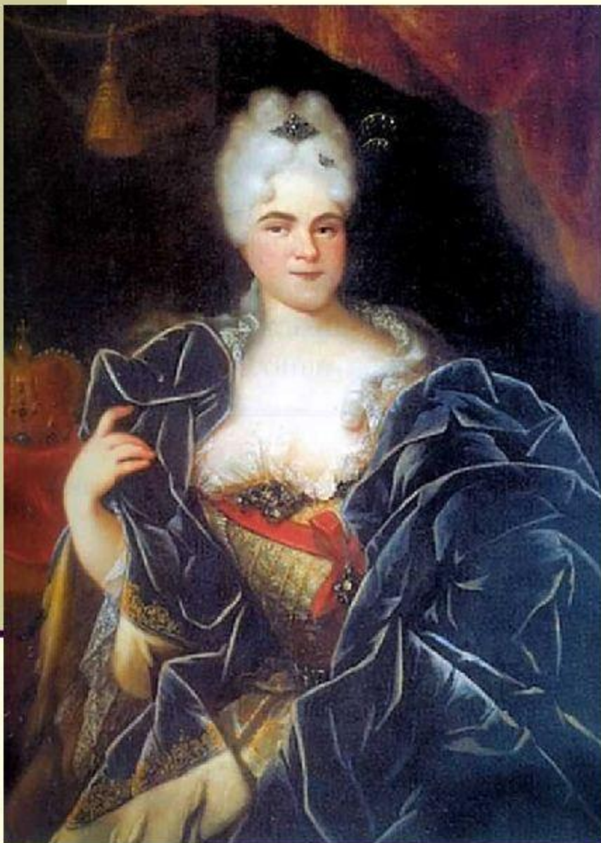
Портрет жены Петра I Екатерины