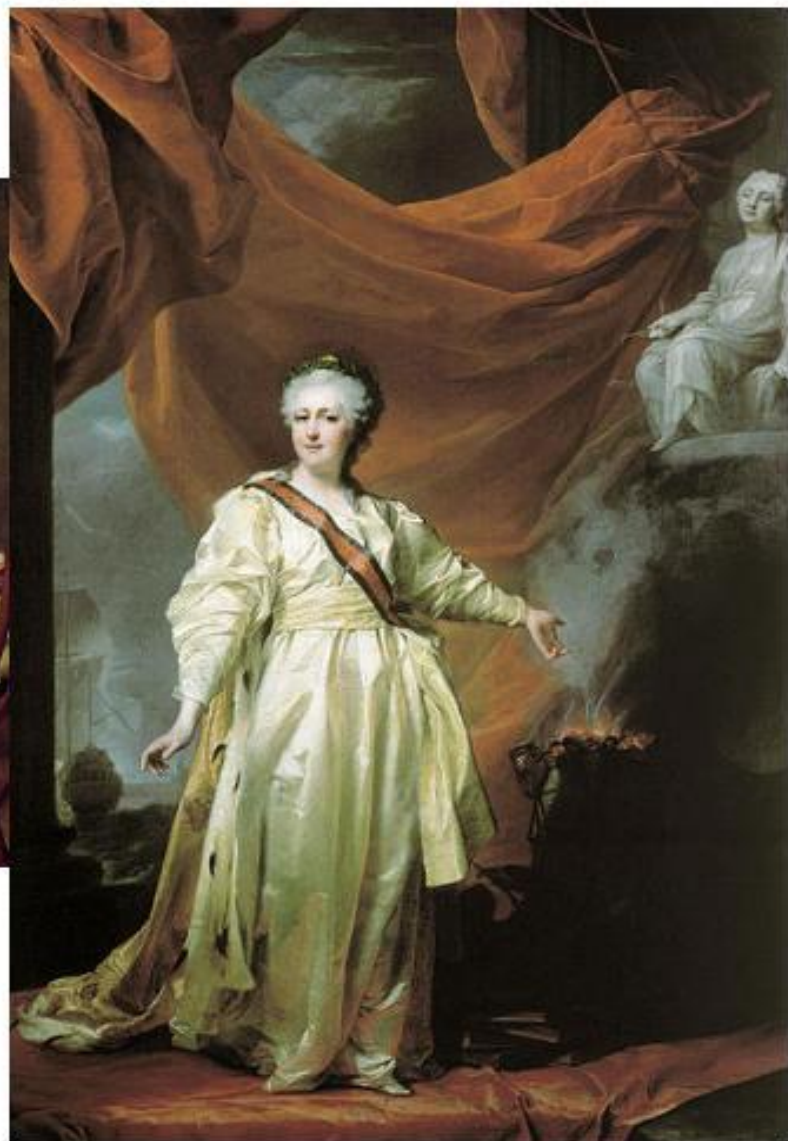
Екатерина II в виде