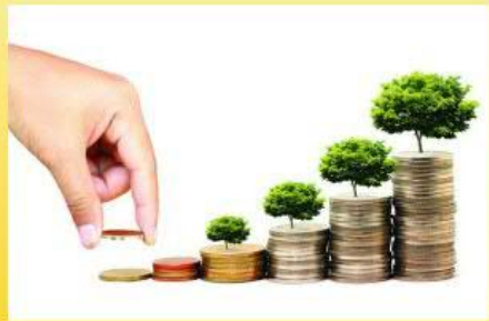
Финансовый план проекта