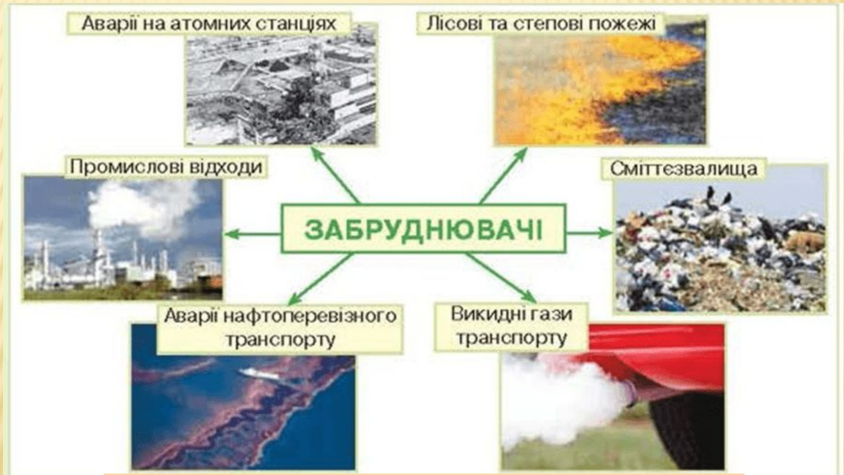
Мал. 160 Джерела забруднення