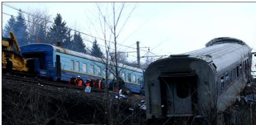
27 ноября 2009 года на железнодорожных путях в районе деревни Лыкошино на 284-м километре Октябрьской железной дороги были заложены два взрывных устройства, сработавшие при прохождении скоростного поезда «Невский экспресс». Шерокип уиёс жизни 27 человек, пострадали более 150 пассажиров.

Для решения своих задач террористы используют холодное и огнестрельное оружие, взрывчатые вещества, химические и бактериологические средства, яды.