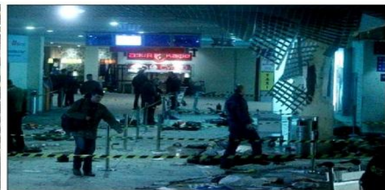
24 января 2011 года в зале прибытия пассажиров международных авиалиний аэропорта Домодедово террорист привел в действие закрепленное на его поясе самодельное взрывное. От взрыва погибли 37 и пострадали 172 человека.