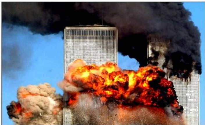
11 сентября 2001 года в США произошёл страшный теракт, унёсший жизни 2 977 людей. Самолёты, угнанные боевиками, врезались в башни-близнецы Всемирного торгового центра.

4. Насилие (или угроза насилия) применяется по отношению к одним лицам, а воздействие по факту оказывается на других, чтобы склонить их к принятию нужных решений.