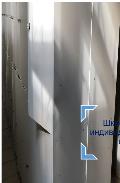
Шкафчик индивидуальны й