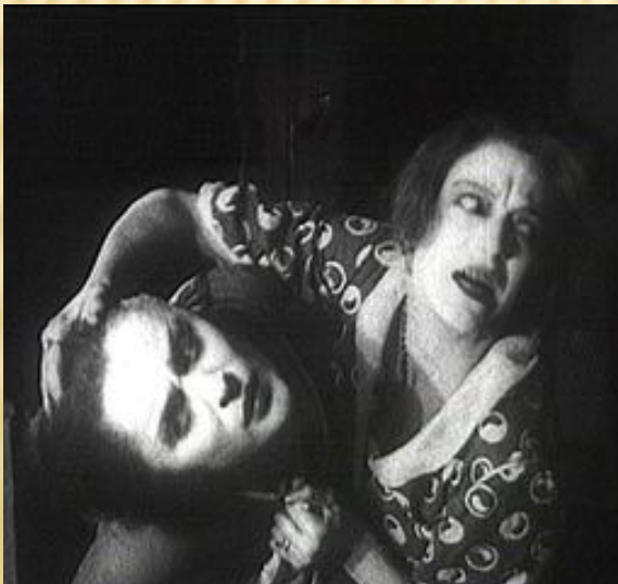
Луї Деллюк «Лихоманка»

Кіноімпресіоністи активно знімали не лише в павільйоні, а й на пленері. Такий недолік німого кіно, як відсутність звуку, перетворювався режисерами на перевагу