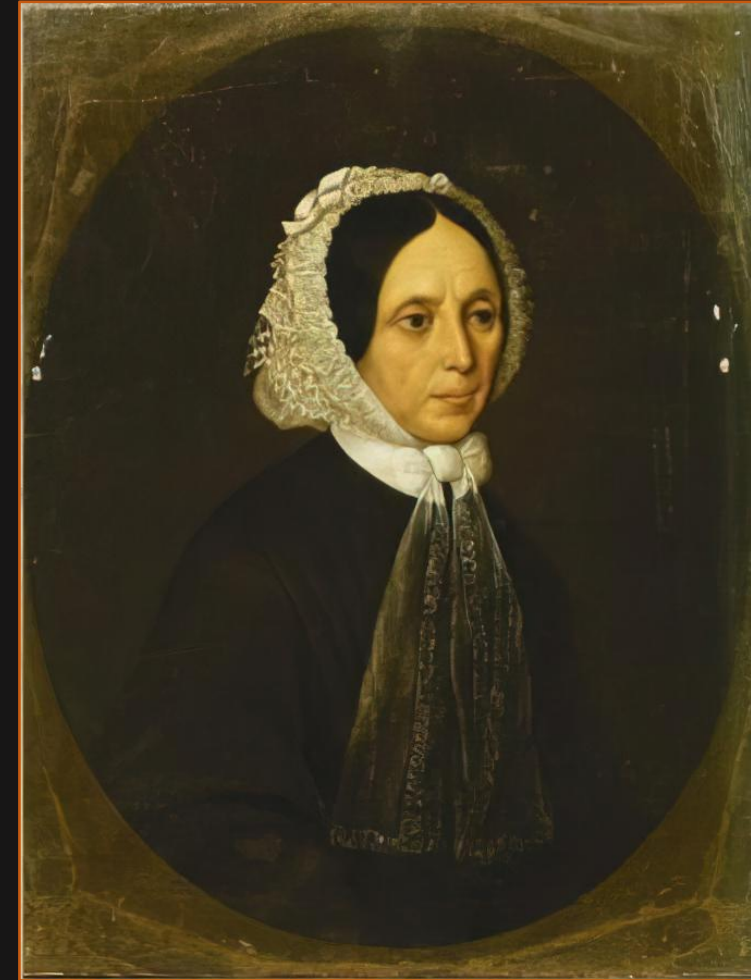
Мария Косяровская – мать Гоголя. Мария Ивановна была натурой впечатлительной, склонной к мистицизму.