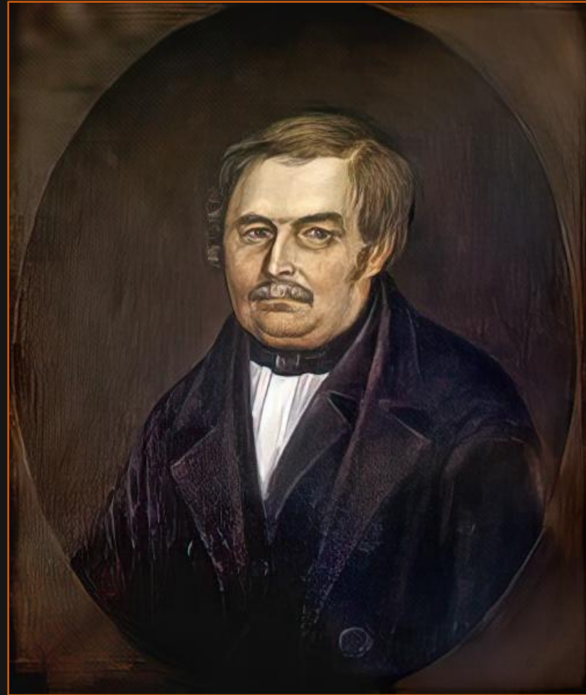
Василий Гоголь-Яновский – отец Гоголя, был коллежским ассессором и служил на почте.