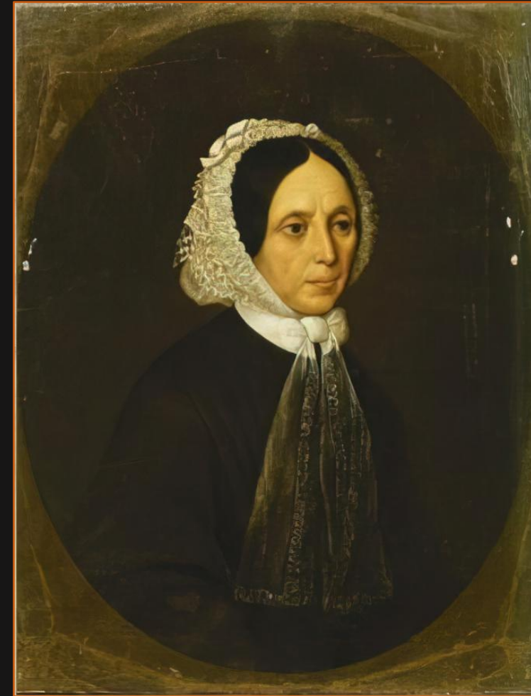
Мария Косяровская – мать Гоголя. Мария Ивановна была натурой впечатлительной, склонной к мистицизму.