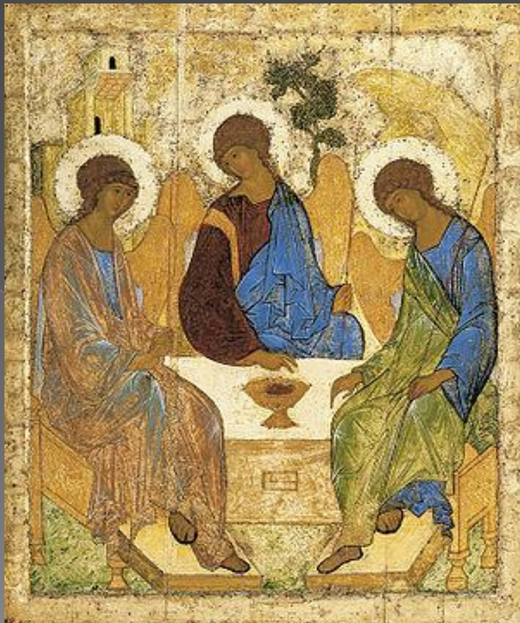
«Троица». Андрей Рублев.