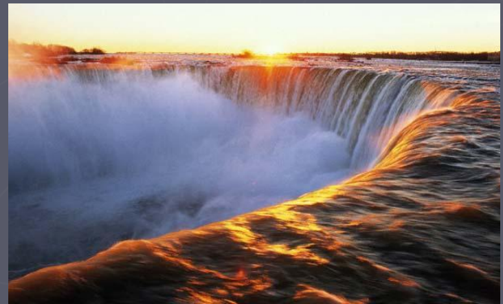
Самая крупная система озер