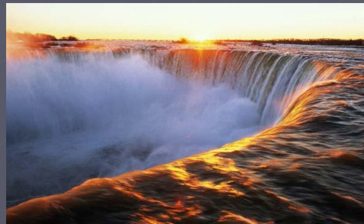
Самая крупная система озер