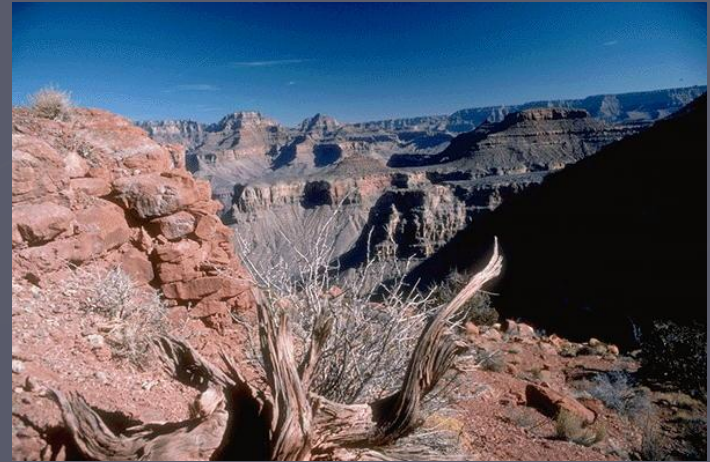
Самый глубокий каньон Гранд-каньон