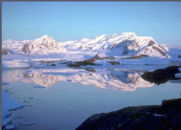
Самый большой остров