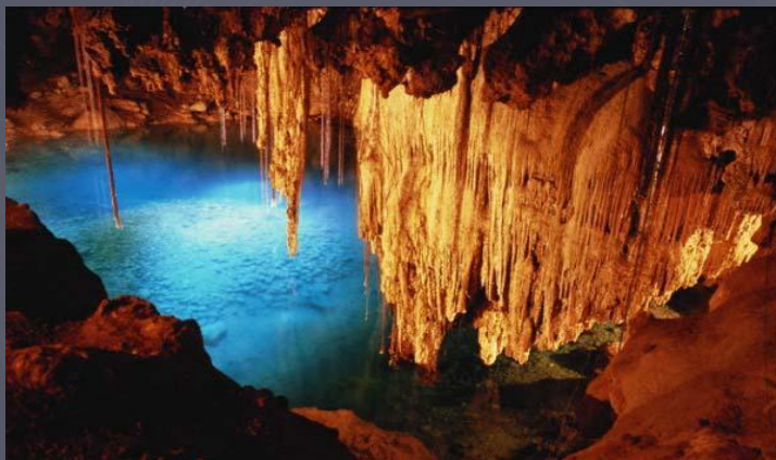
Самая длинная пещера