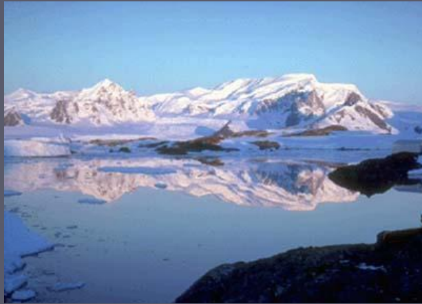
Самый большой остров