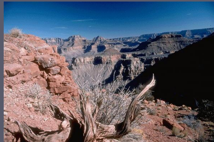
Самый глубокий каньон Гранд-каньон