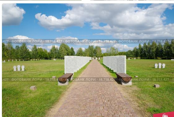
Город Ржев, Тверская область. Немецкое военное кладбище