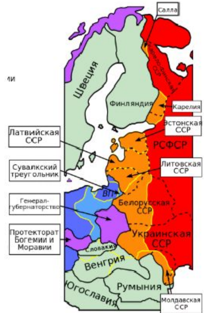
действительные территориальные изменения в 1939 — 1940