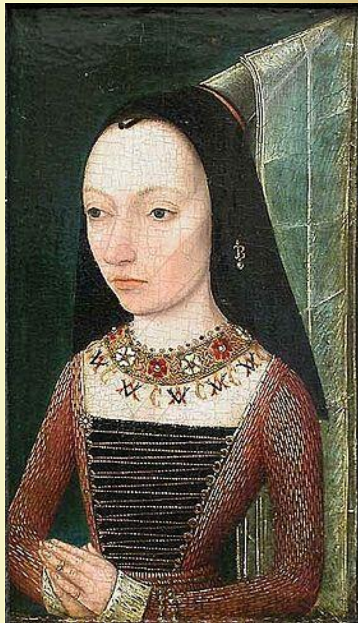
Чарльз зе Болд. Портрет Маргариты Йоркской, около 1468 год. Лувр