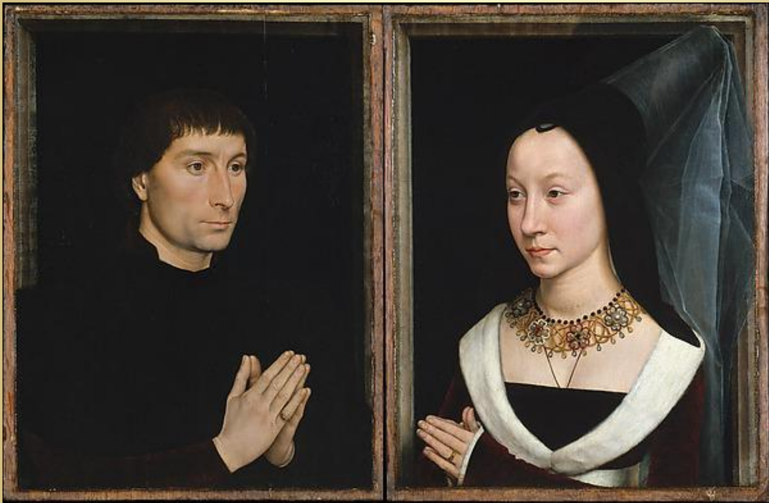
Портреты Томассо де Портинари и Марии Портинари (Мария Маддалена Барончелли) Tommaso di Folco Portinari (1428–1501); Maria Portinari (Maria Maddalena Baroncelli, born 1456)