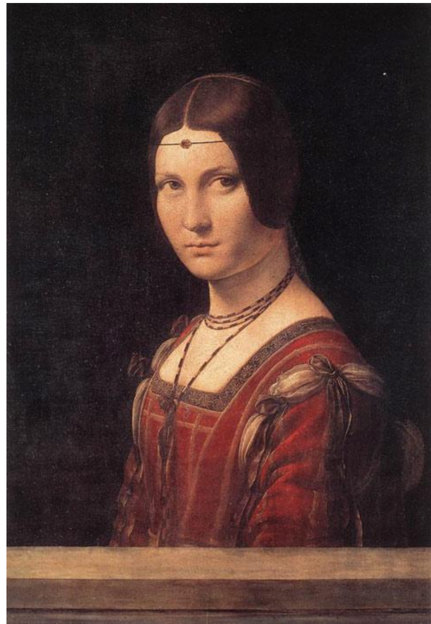
Леонардо да Винчи «Прекрасная Ферроньера» 1495 г. Дерево, масло. 62 × 44 см. Лувр, Париж