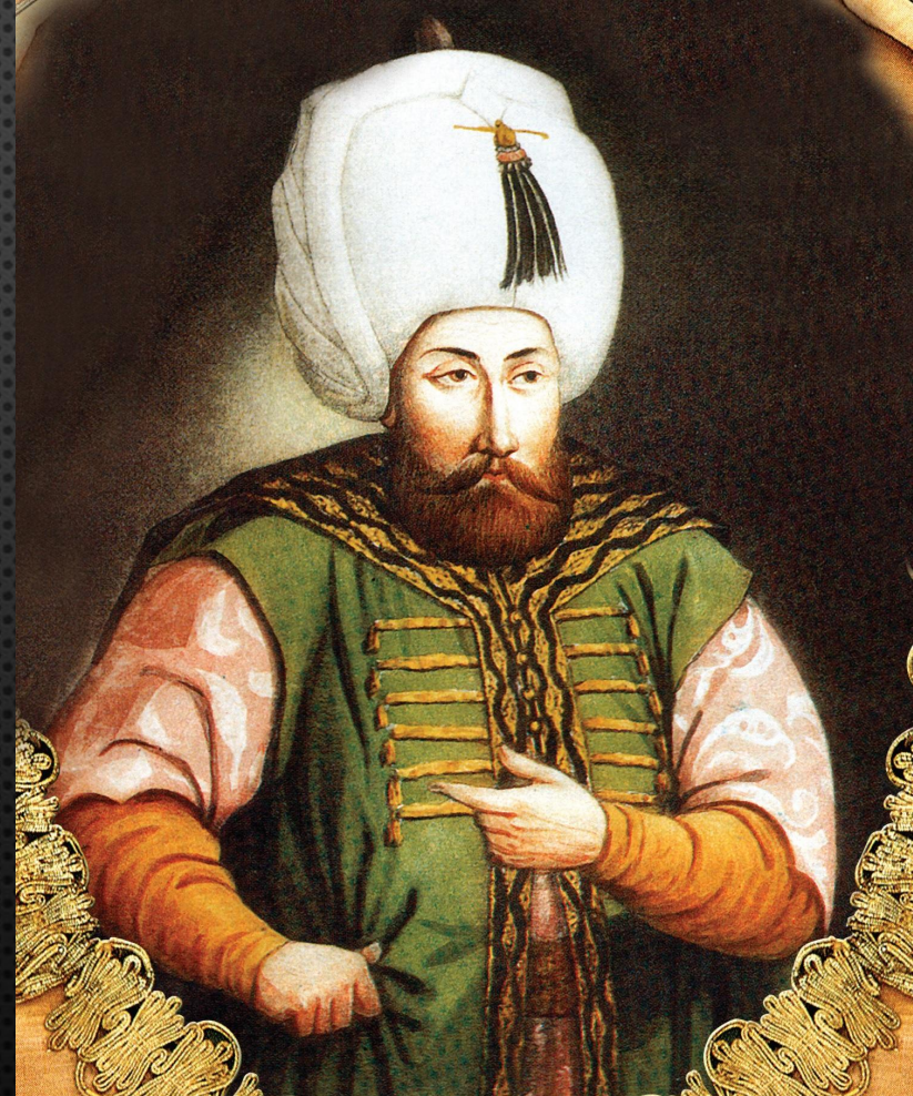
СУЛТАН СЕЛИМ II ГРОЗНЫЙ