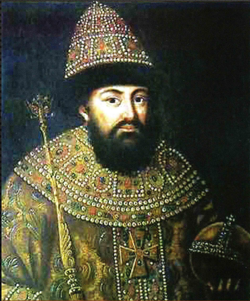
КНЯЗЬ ИВАН III