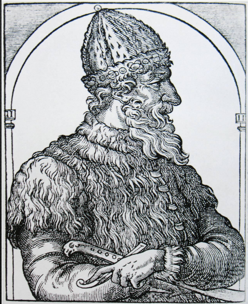
Князь ВАСИЛИЙ III