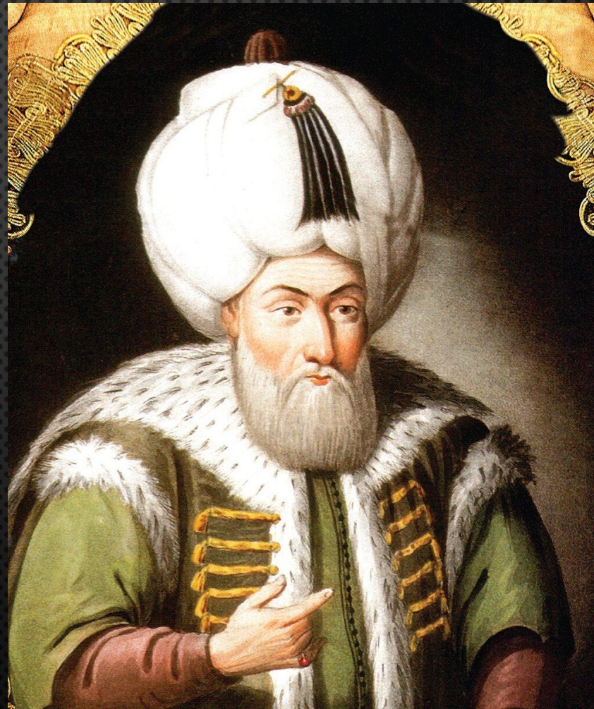
СУЛТАН БАЯЗИД II