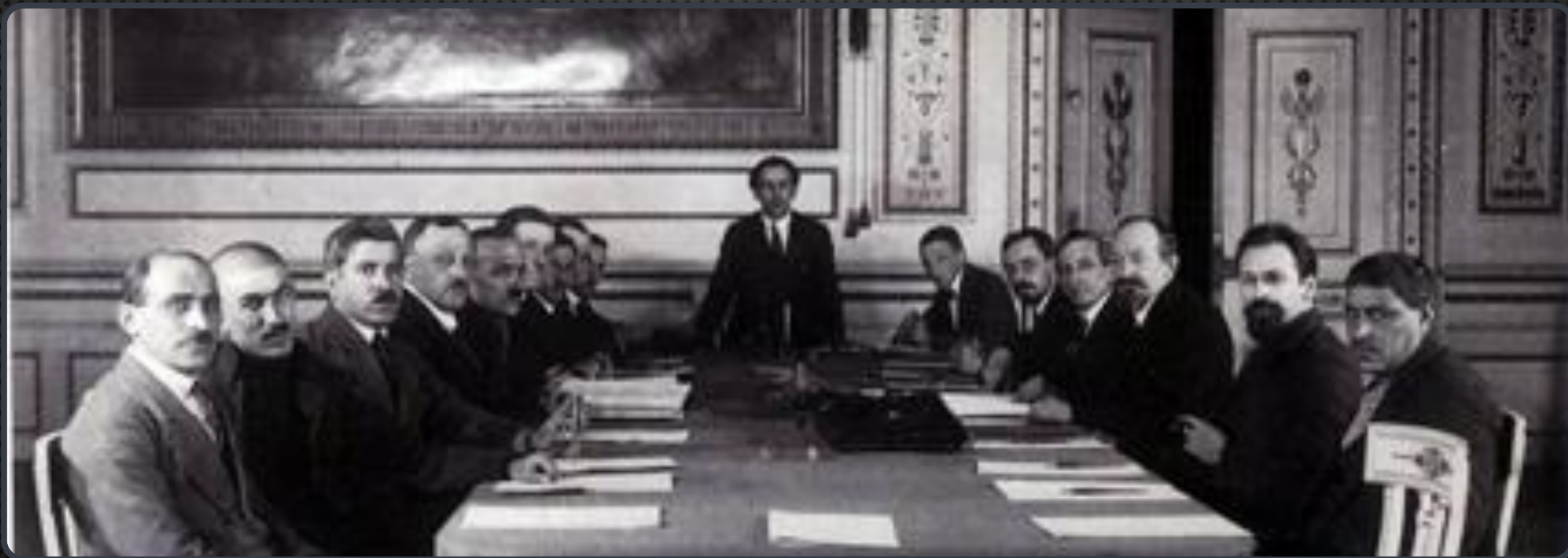
ПОДПИСАНИЕ МОСКОВСКОГО ДОГОВОРА (1921)