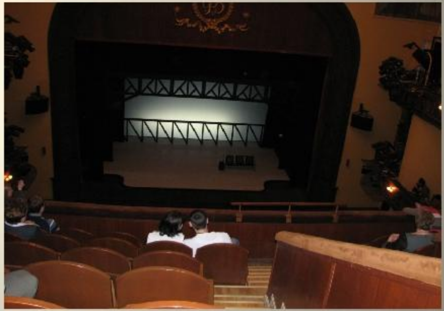
Интерьер театра создаёт особую атмосферу