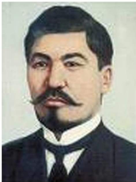
А. Бокейханов- председатель Алаш- Орды.