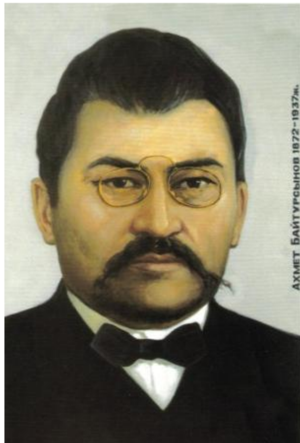
А. Байтурсынов – редактор газеты «Казах».