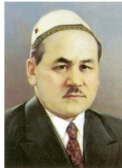
М. Чокай – председатель Кокандской автономии.