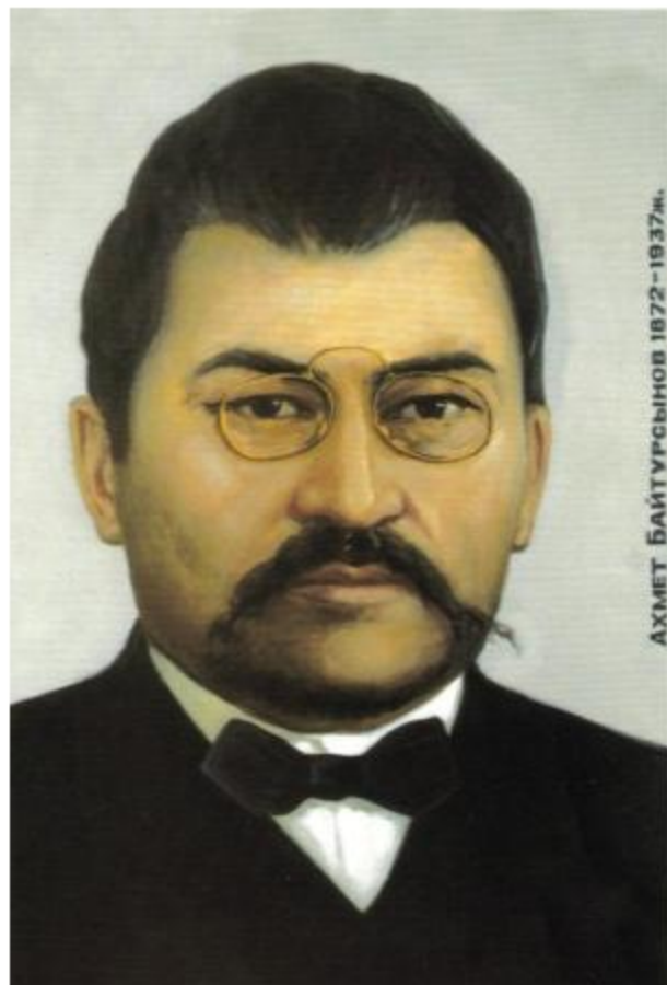
А. Байтурсынов – редактор газеты «Казах».