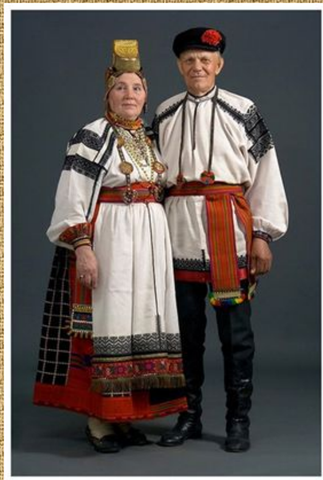
КОСТЮМЫ Красненского и Красногвардейского района