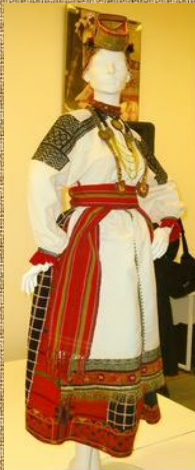
женский праздничный костюм, с.Афанасьевка XIX в