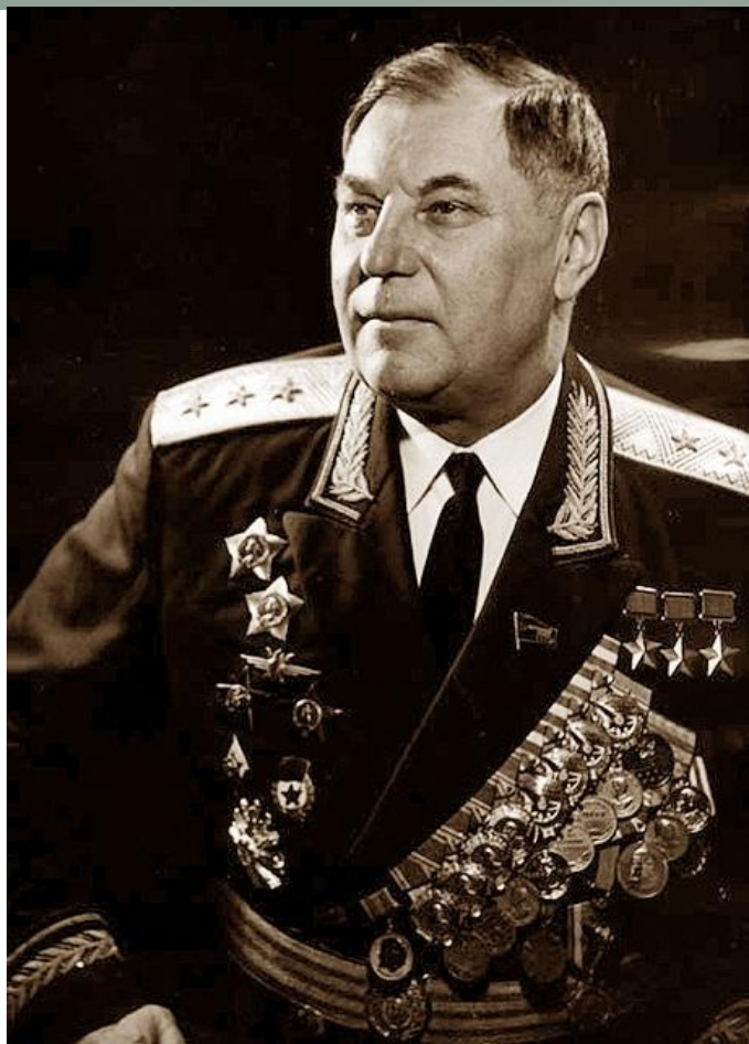
А.И. Покрышкин трижды Герой Советского Союза.

В годы Великой Отечественной войны многие получили звание Героя Советского Союза.