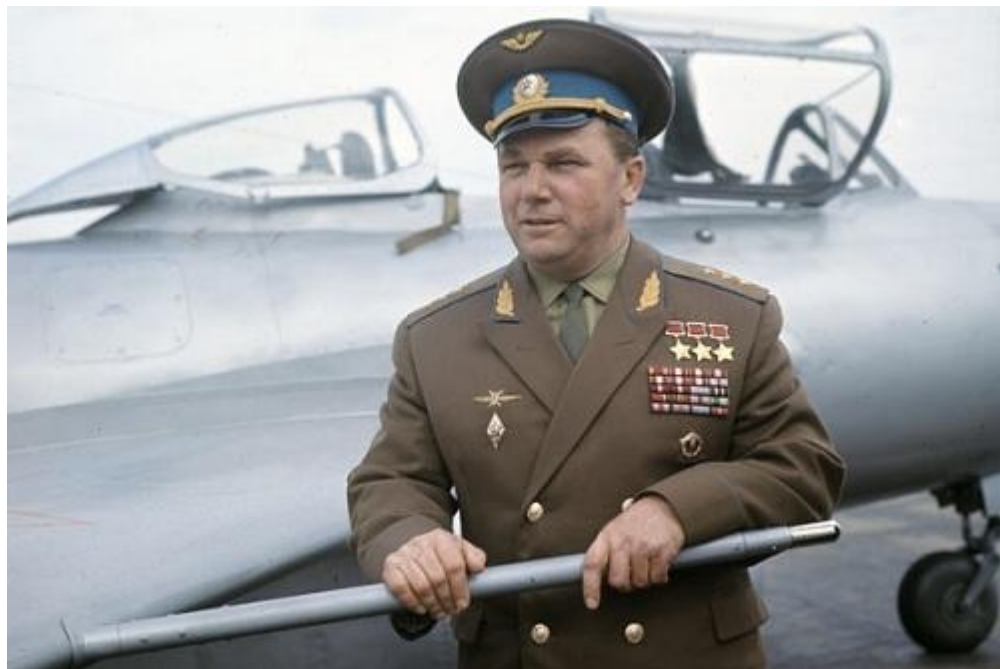
И.Н. Кожедуб трижды Герой Советского Союза

В годы Великой Отечественной войны многие получили звание Героя Советского Союза.