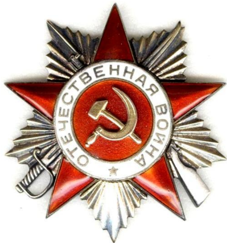
Орден Отечественной войны

Учрежден в 1942 г. Награждались проявившие в боях за Советскую Родину, храбрость, стойкость и мужество.