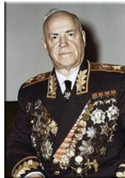
Маршал Г.К. Жуков

Первым орденом Победы были удостоены маршал Г.К. Жуков и А.М. Васильевский