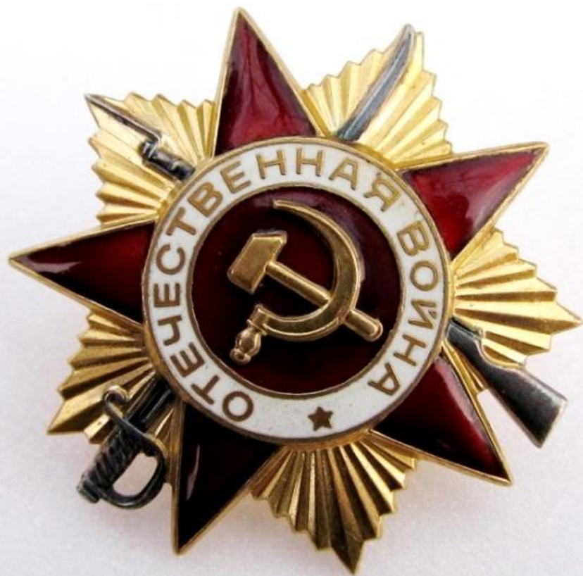
Орден Отечественной войны