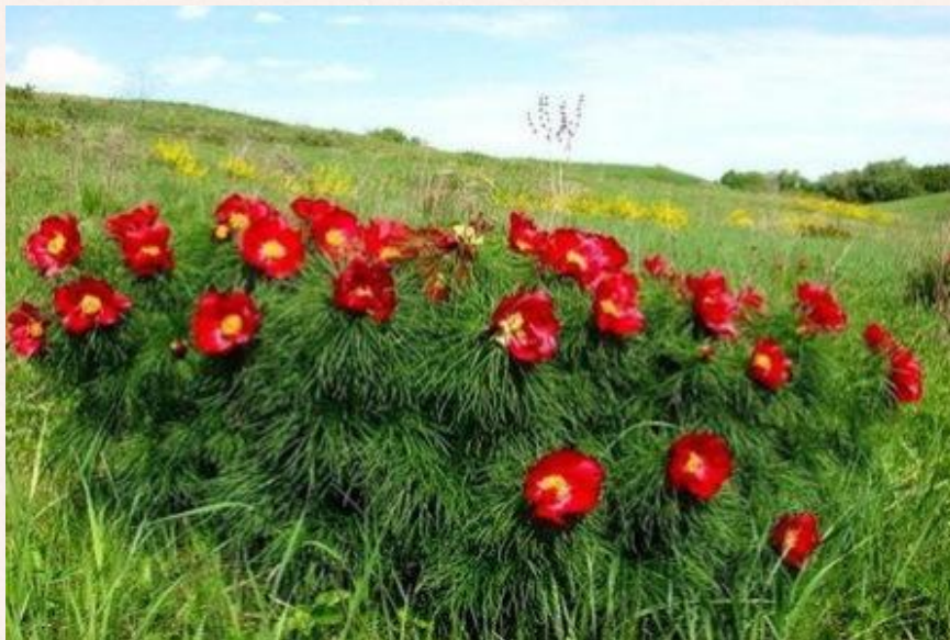
Пион узколистный (воронец)