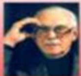
слова: С.В. Михалков

Принят Государственной Думой 8 декабря 2000 года