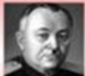
музыка: А.В. Александров

Гимн - торжественное музыкальное произведение, исполняемое при всех официальных случаях.