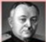
музыка: А.В. Александров

Гимн - торжественное музыкальное произведение, исполняемое при всех официальных случаях.