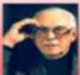
слова: С.В. Михалков

Принят Государственной Думой 8 декабря 2000 года