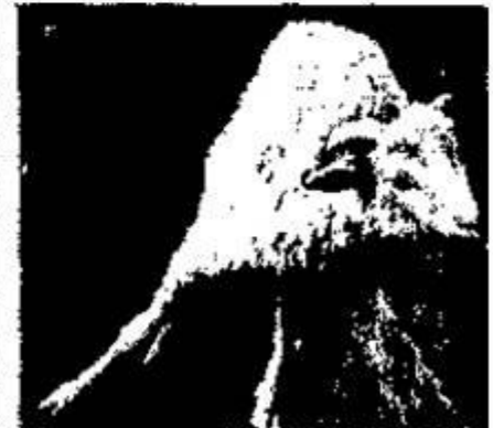
Рис. 5. Клиническая картина листериоза у овец: а) искривление шеи и ненормальное положение головы; б) круговые движения, парез тазовых конечностей; в) потеря равновесия, парез конечностей.