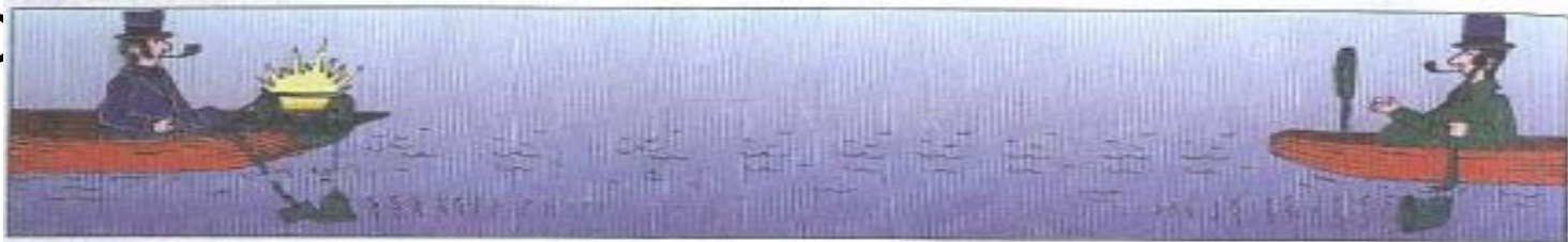
Измерение скорости звука в воде (1827)