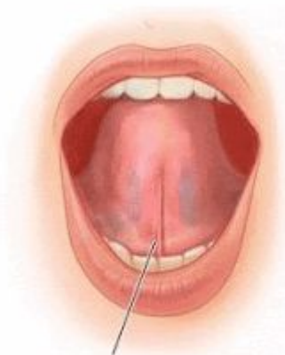
УЗДЕЧКА ЯЗЫКА В НОРМЕ