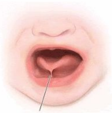
КОРОТКАЯ УЗДЕКА ЯЗЫКА