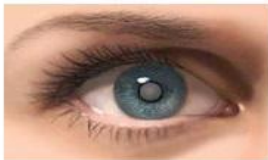
глаз с катарактой