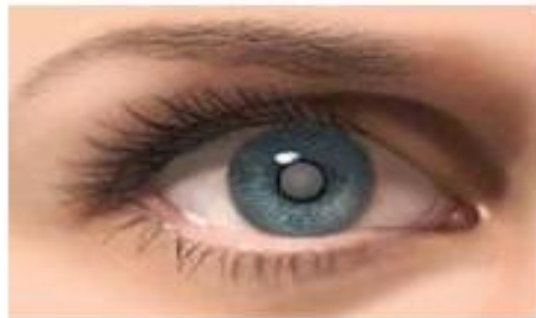
глаз с катарактой