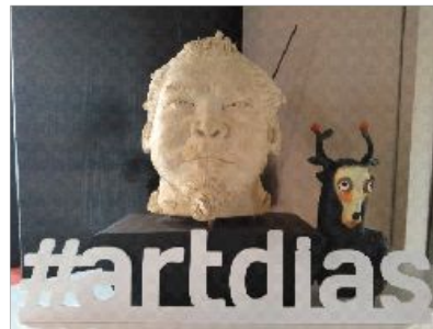
фото и текст

ДНЕВНИК ГАЛЕРИСТА рубрика о планируемых мероприятиях, отчет о прошедших и т.д. через призму отношения руководителя галереи. Как своеобразный Дневник