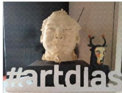
фото и текст

ДНЕВНИК ГАЛЕРИСТА рубрика о планируемых мероприятиях, отчет о прошедших и т.д. через призму отношения руководителя галереи. Как своеобразный Дневник