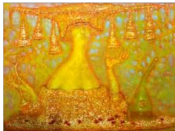
фото картины без рамы, текст

о картинах, которые находятся в коллекции галереи, о тех, которые экспонируются или готовятся к продаже