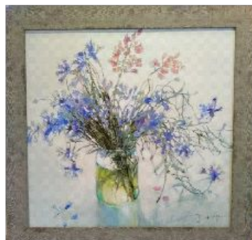
фото подарка (если картина, то в раме)

о том, что можно купить прямо сейчас, кому подарить, сколько стоит и какое эмоционально-чувственное состояние будет у человека, которому ЭТО подарили