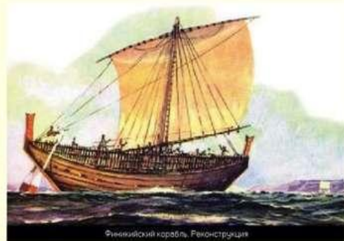
Финикийский корабль. Реконструкция

3. С какой целью финикийцы основывали колонии?