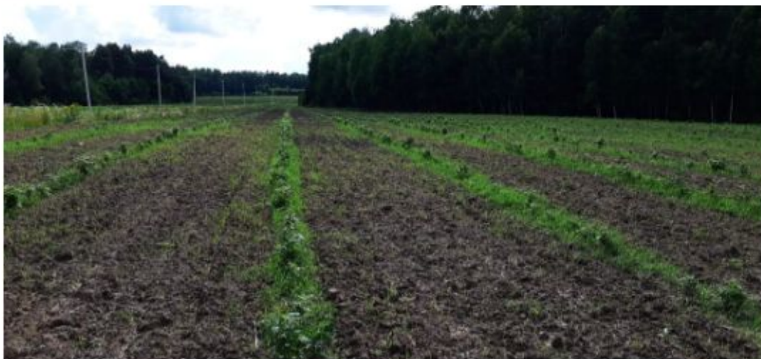
Плантация 1 год

Поэтому нам выгодно выкупить право долгосрочной плантации малины обратно через год, по цене её приобретения