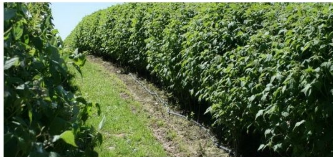
Плантация 2-й год

Предлагаемый нами бизнес имеет большой запас прочности, и является выгодным финансово доступным, как для начинающих, так и для опытных бизнесменов.