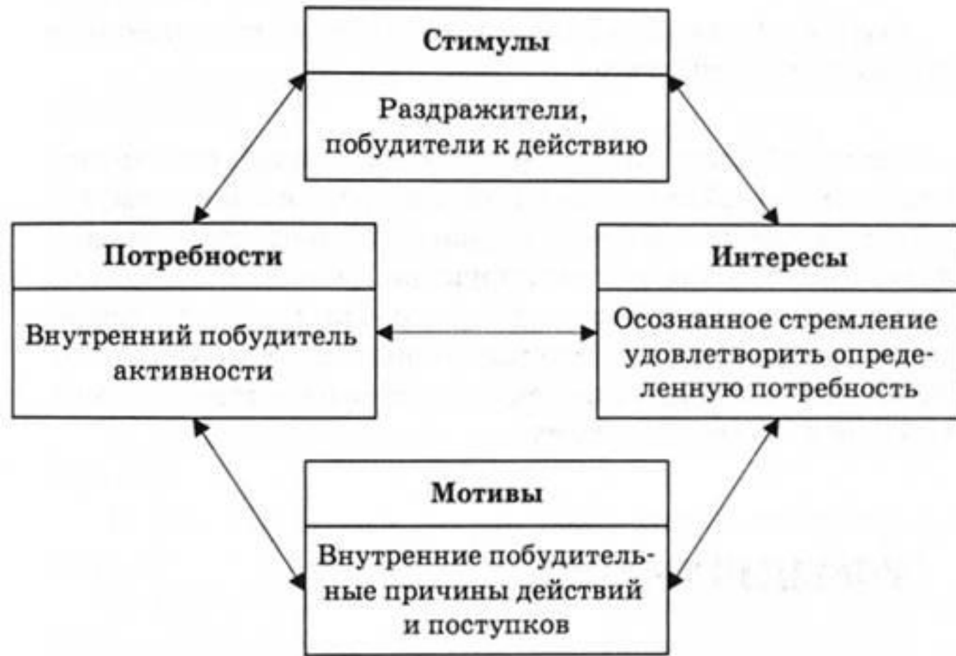
Рис. 2.7. Взаимосвязь потребностей, мотивов, стимулов и интересов

В ЕЕ ОСНОВЕ – ГЛУБОКАЯ УСТОЙЧИВАЯ ПОТРЕБНОСТЬ ИНДИВИДА В НЕКОЕЙ ДЕЯТЕЛЬНОСТИ, СТРЕМЛЕНИЕ СОВЕРШЕНСТВОВАТЬ УМЕНИЯ И НАВЫКИ, СВЯЗАННЫЕ С ЭТОЙ ДЕЯТЕЛЬНОСТЬЮ. ПОЯВЛЕНИЕ СКЛОННОСТИ ОБЫЧНО ЯВЛЯЕТСЯ ПРЕДПОСЫЛКОЙ РАЗВИТИЯ СООТВЕТСТВЕННЫХ СПОСОБНОСТЕЙ. НЕ ВСЕГДА ИНТЕРЕС СОЧЕТАЕТСЯ СО СКЛОННОСТЬЮ (МНОГОЕ ЗАВИСИТ ОТ СТЕПЕНИ ДОСТУПНОСТИ ТОЙ ИЛИ ИНОЙ ДЕЯТЕЛЬНОСТИ).