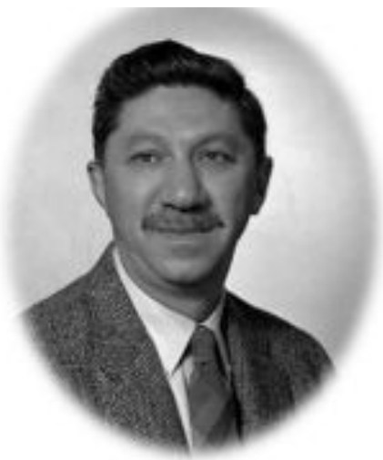
АБРАХАМ МАСЛОУ (1908- 1970 Г.Г.) — АМЕРИКАНСКИЙ ПСИХОЛОГ, ОСНОВАТЕЛЬ ГУМАНИСТИЧЕСКОЙ ПСИХОЛОГИИ