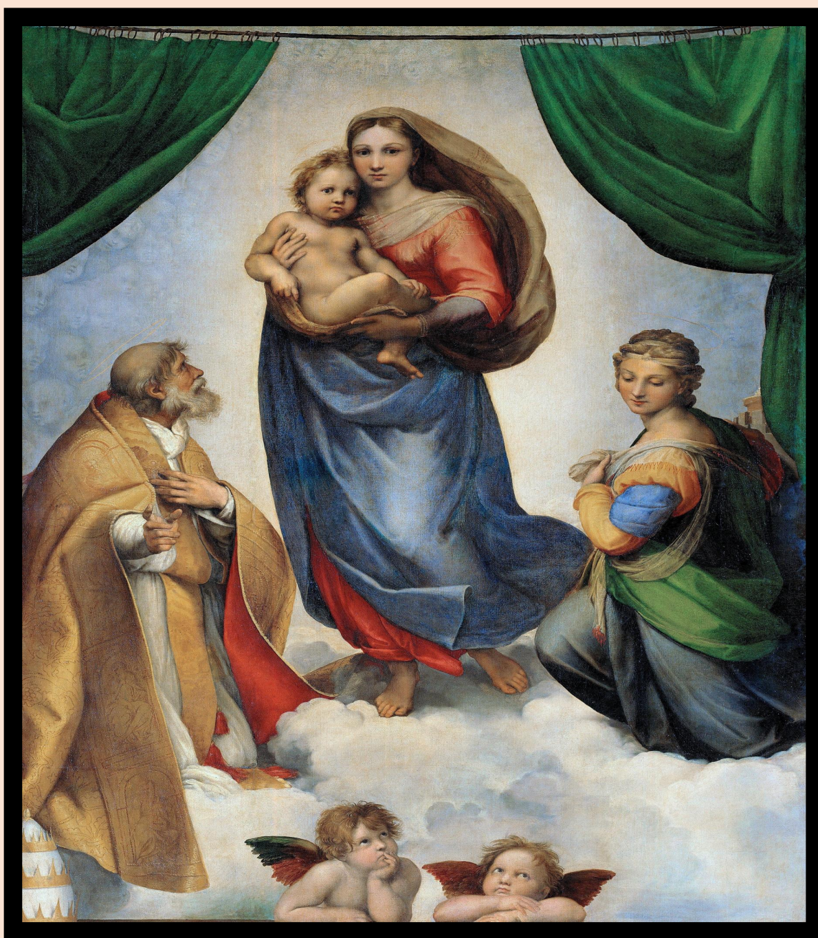
Размер фрески: 265 × 196 см