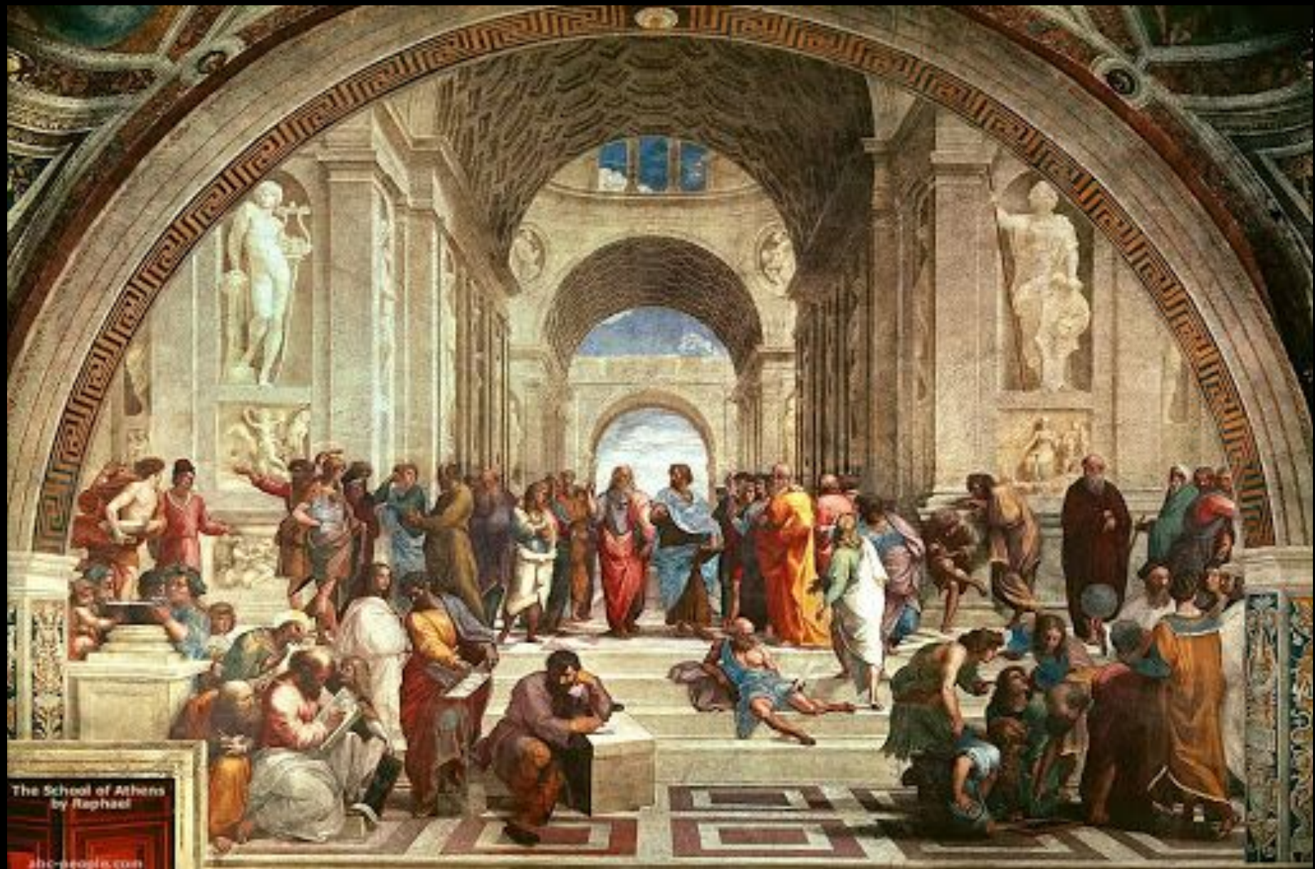
Размер картины: 500 × 770 см