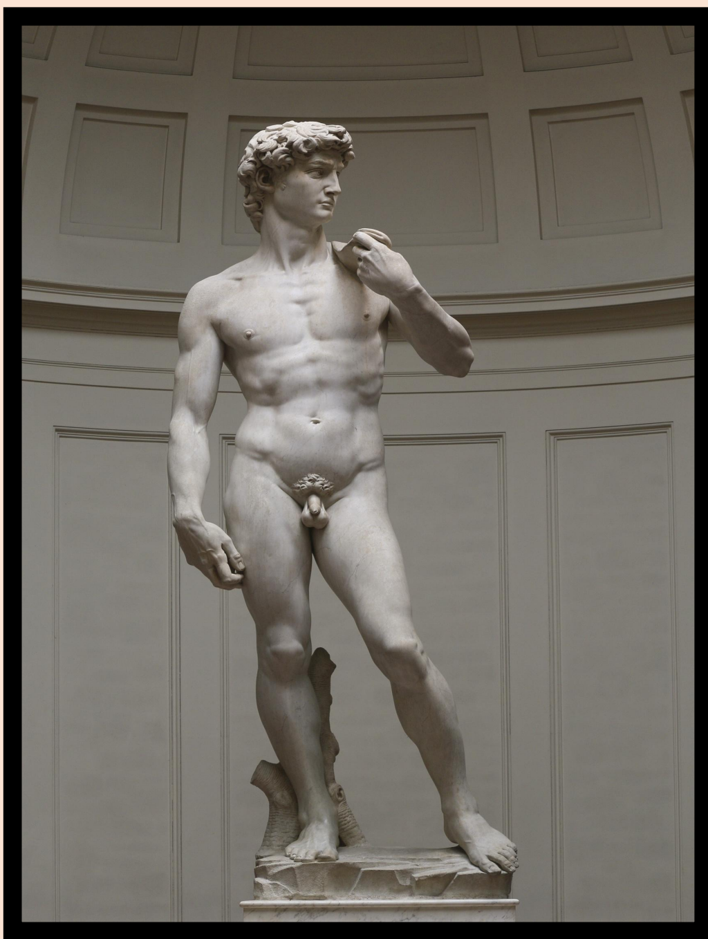
Мрамор. Высота 5,17м