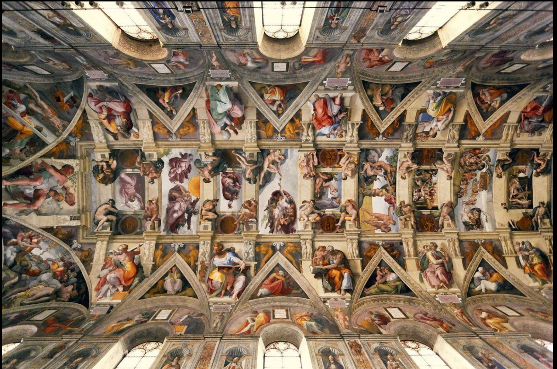
Размер: высота 21м