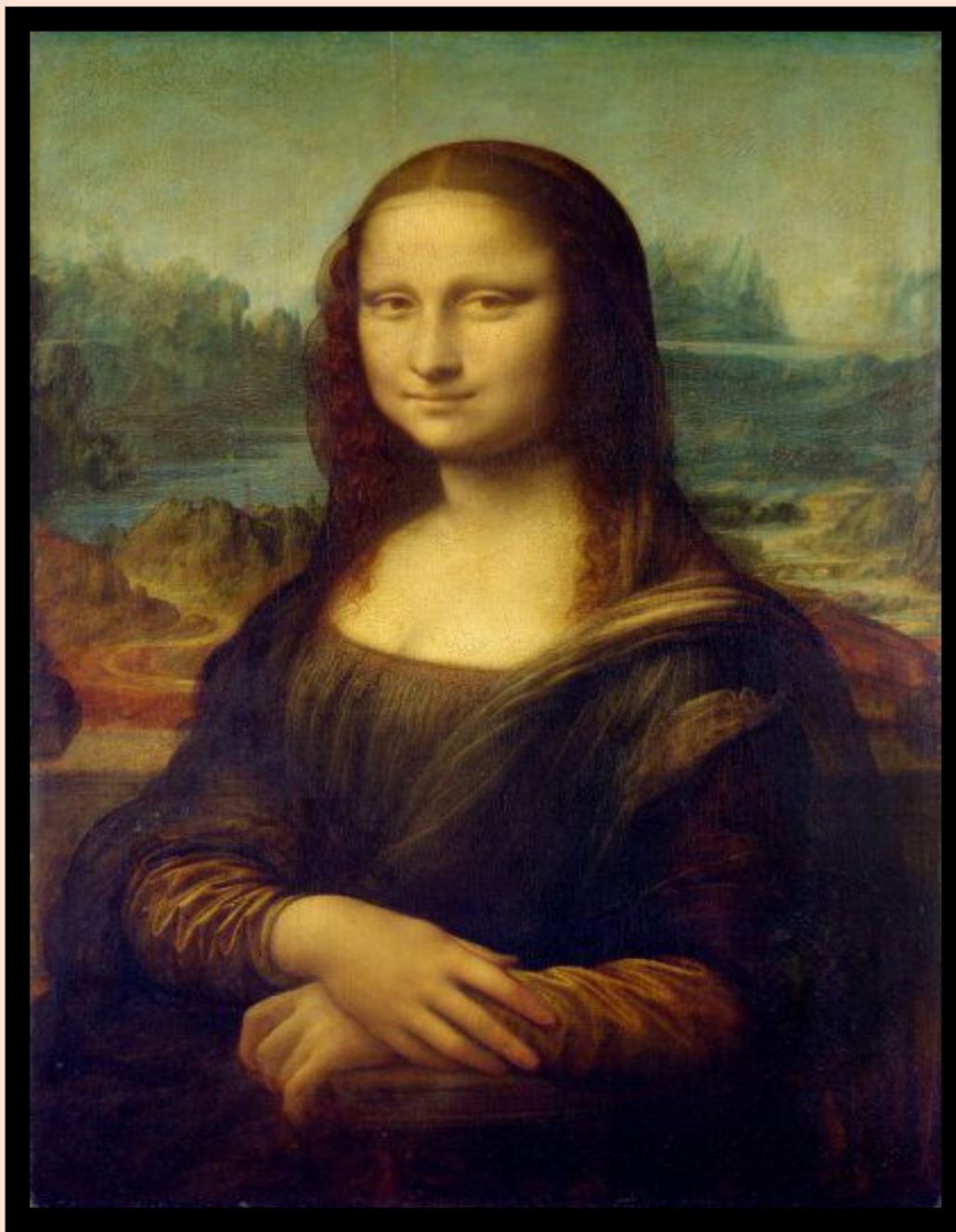
Размеры картины: 77 х 53см