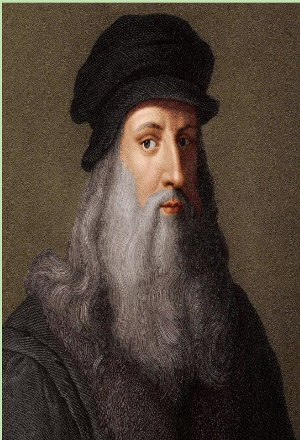
Леонардо да Винчи (1452-1519г)