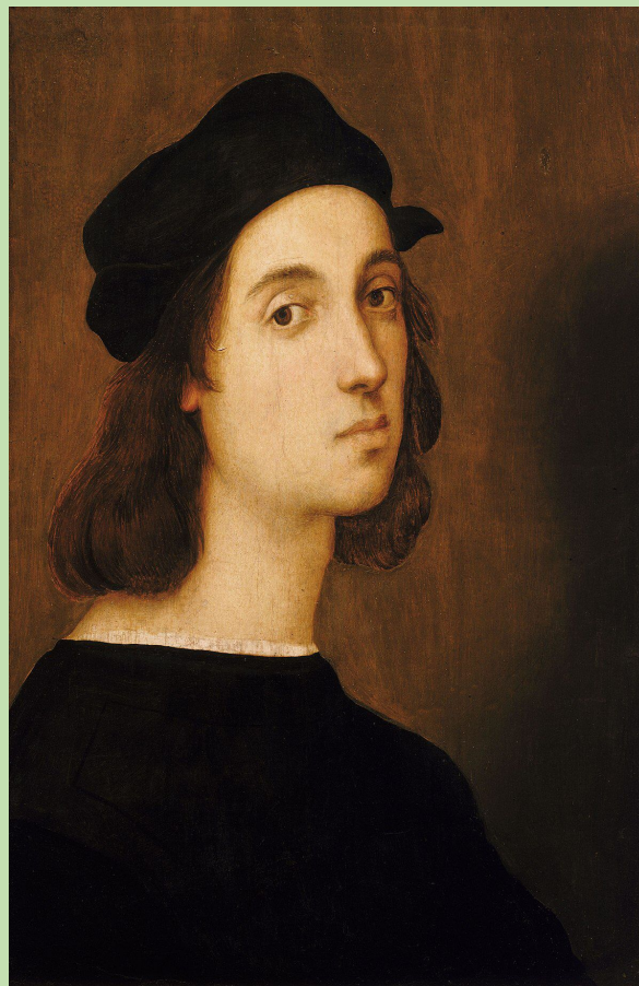
Рафаэль Санци (1483-1520г)