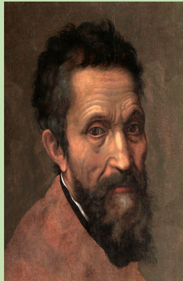
Микеланджело Буонарроти (1475-1564г)