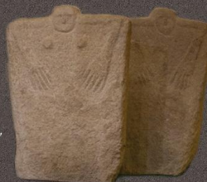
Антропоморфные изваяния, 2 тысячелетие до н.э.