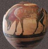
Тулова чернофигурной амфоры с изображением вепря (фрагмент), Рубеж VII-VI вв. до н.э.