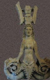
Двусторонний акротерий: статуя-полуфигура «змееногой» богини

Месторасположение: город Керчь, ул. Свердлова, 22 Контакт: +7 36561 21860 Часы работы: Выходной день: