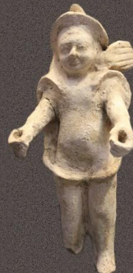
Фигура Эроса рубеж I-II в. н.э.

Месторасположение: город Керчь, ул. Свердлова, 22 Контакт: +7 36561 21860 Часы работы: Выходной день: