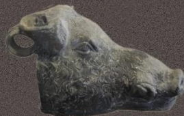
Сосуд в виде головы кабана II-I в. до н.э.