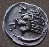
Пантикапей. Тетрахалон. 315-300 гг. до н.э.