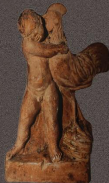
Терракотовая статуэтка мальчика с петухом II-I в. до н.э.