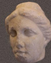
Голова богини (фрагмент статуэтки)