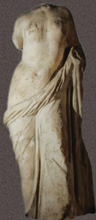
Статуя Афродиты III в. до н.э.

Экспозиция «История Боспорского царства», построенная в 2006 г., располагается в четырёх залах на первом этаже. Её предваряет раздел «Первобытный период на Керченском полуострове». В разделе «Скифы Восточного Крыма» представлены замечательные археологические комплексы середины IV в. до н.э. из раскопок Трёхбратних курганов. Раздел «Архаический Боспор» наглядно демонстрирует более чем 26-вековой возраст города Керчи, исторического преемника древнего Пантикапея, основанного греками-колонистами из города Милет. Столица Боспорского государства – Пантикапей – располагалась на пяти больших террасах горы, возвышающейся над городом. У моря – гавань и доки, рядом с агорой. В период расцвета город занимал площадь более 100 га с населением 45 000 жителей. Зал № 2 посвящён истории Боспорского государства в классический и эллинистический периоды, когда происходил расцвет экономики и культуры. В зале № 3 показаны исторические явления эллинистическо-римского периода. Последний зал посвящён погребальным культам и культуре Боспора.