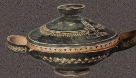
Лекана чернолаковая расписная III в. до н.э.

После гражданской войны Керченский музей был включён с 1920 года в систему Народного образования Крыма и в 1922 году размещён в доме бывшем табачного фабриканта П.К. Месаксуди, покинувшего родину в 1919 г. Это здание было построено в 1896 году в стиле модерн. В нём музей находится и поныне. Экспозиции тогда же были перестроены на основе принципов исторического материализма. Музей приобрёл просветительские функции. Во время Великой Отечественной войны Керченский музей понёс тяжёлые невосполнимые потери.