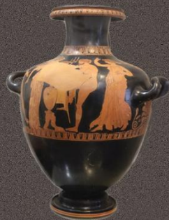
Чёрнофигурная гидрия, V в до н.э.