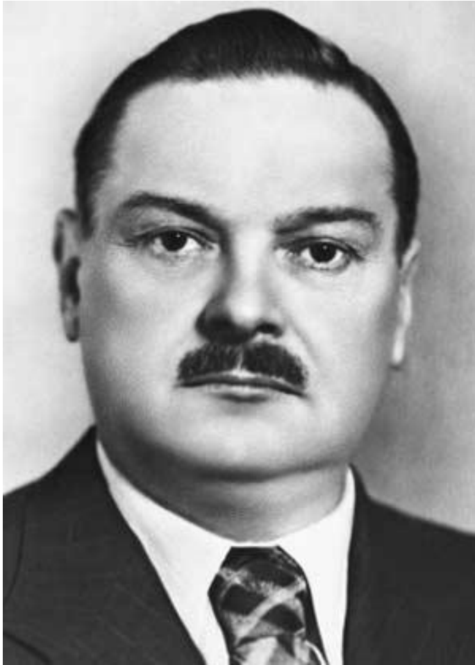
Партийный деятель А. А. Жданов.