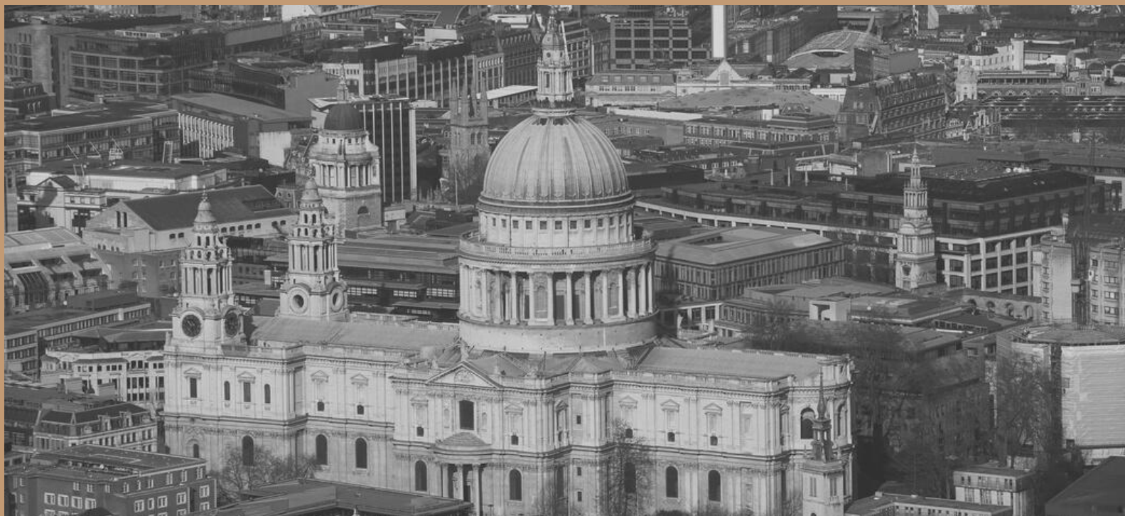
СОБОР СВЯТОГО ПАВЛА В ЛОНДОНЕ

"Хочу собор как в Ватикане" сказал Павел Первый