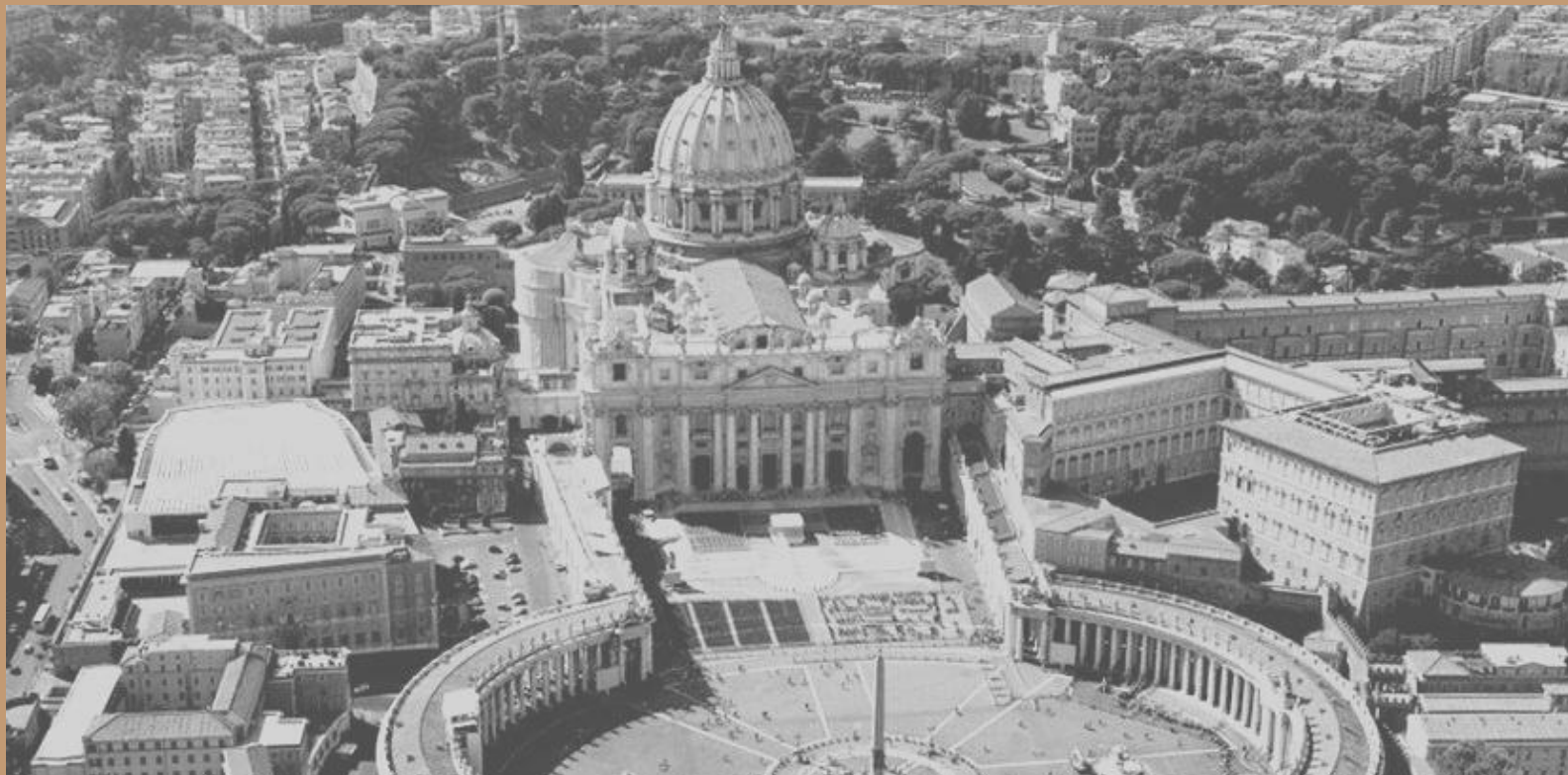
СОБОР СВЯТОГО ПЕТРА В ВАТИКАНЕ

"Хочу собор как в Ватикане" сказал Павел Первый