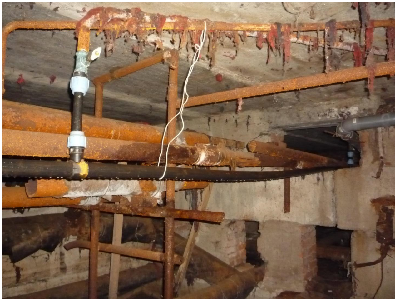
Котельнич, Чапаева, 35