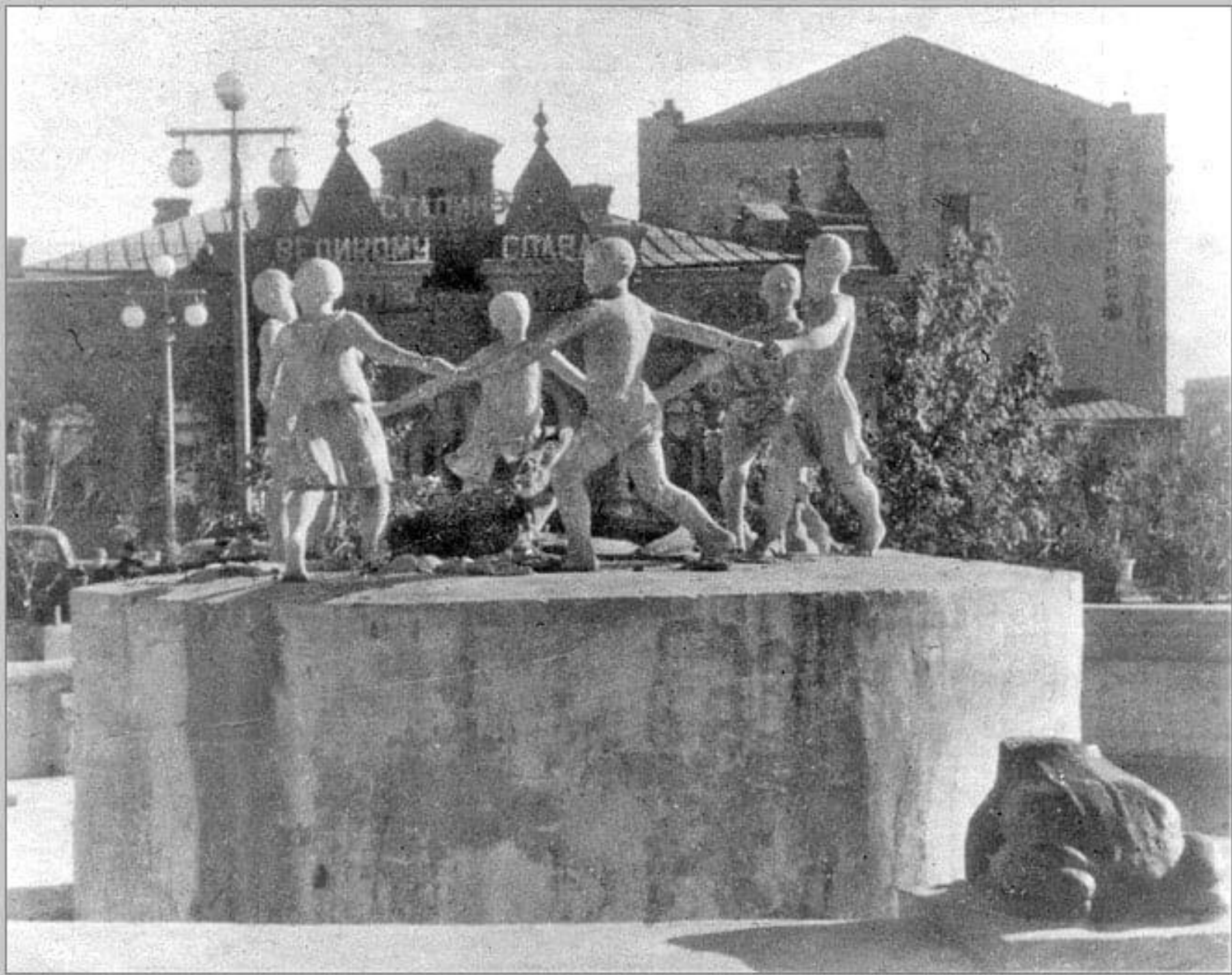
Фонтан «Детский Хоровод»