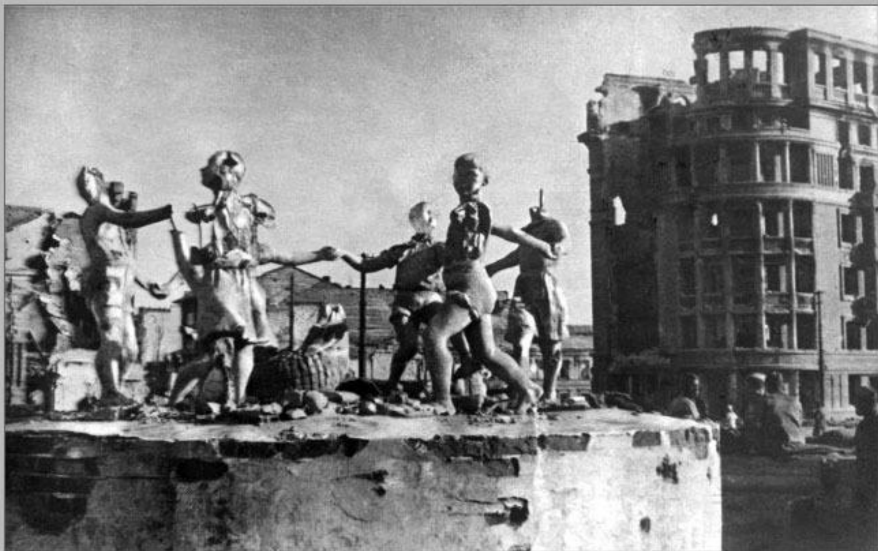
Фонтан на вокзальной площади