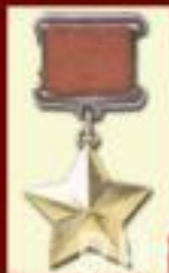
Медаль "Золотая Звезда"