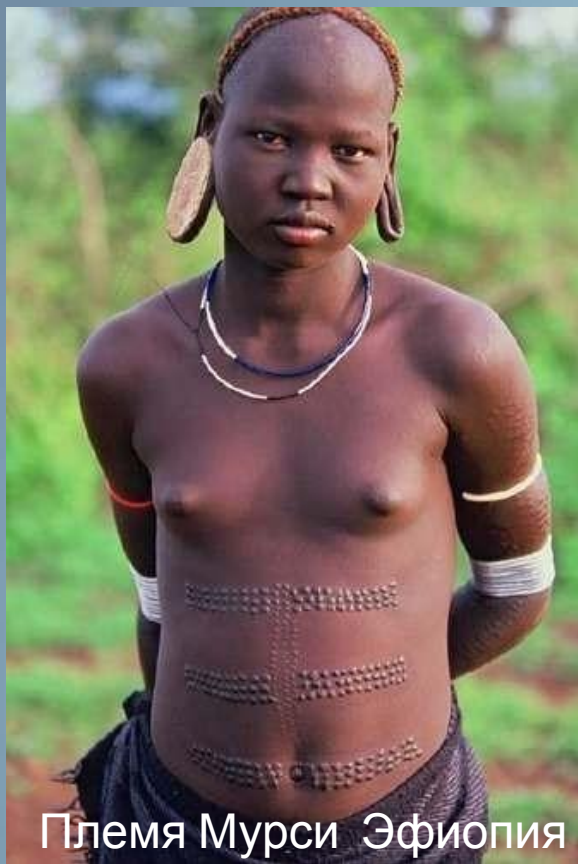
Племя Мурси Эфиопия

Сначала люди украшали себя рисунками и татуировками на теле.