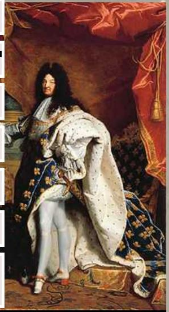
Людовик XIV (1638-1715)

Вырабатывается теория, обосновывающая законность и необходимость абсолютизма