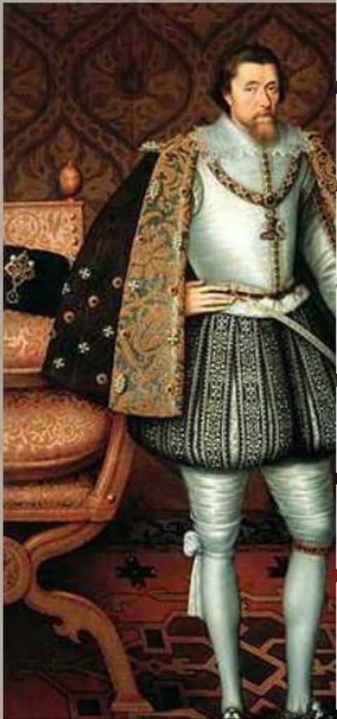
Яков I (1566-1625)

Монарх сосредотачивает в своих руках все ветви власти