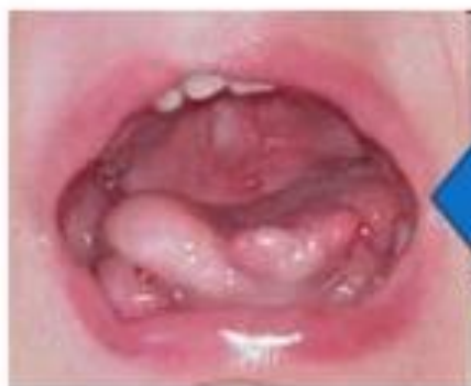
Микроглоссия вследствие разделения языка на дольки

Дефекты языка. К аномалиям развития языка относится полное его отсутствие (аглоссия). К врождённым дефектам развития относится также недоразвитие языка, когда размеры его оказываются чрезмерно малыми (микроглоссия), и ненормально большой язык (макроглоссия), когда в результате мышечной гипертрофии язык увеличен настолько, что не помещается во рту и выступает наружу между зубами.