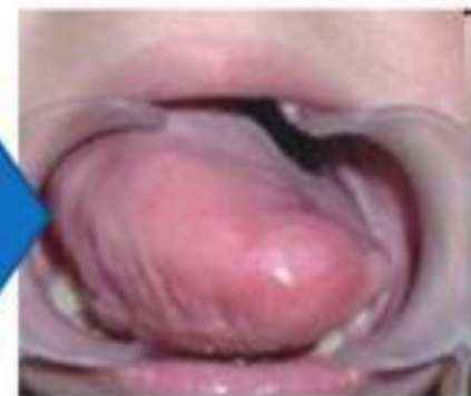
Макроглоссия вследствие опухолевого поражения